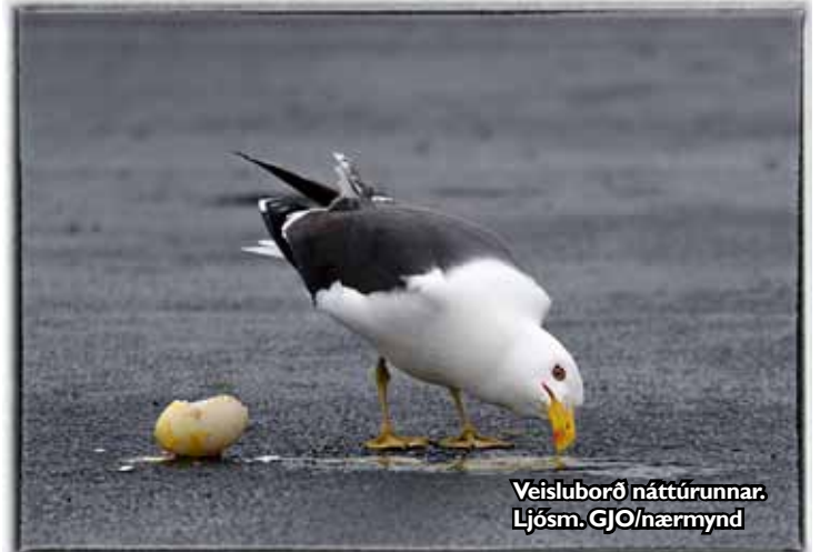
Veisluborð náttúrunnar. Ljós. GJO/nærmynd

Allir sem að stöðu eiga þakkir skyldar og hamingjuóskir með glesilegan árangur.