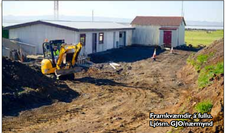
Framkvæmdir á fullu. Ljós. GJO/nærmynd

Að undaförnu hefur verið mikið rask vegna framkvæmda við veg og starfsaðstöðu framan við vélageymslu klúbbsins.