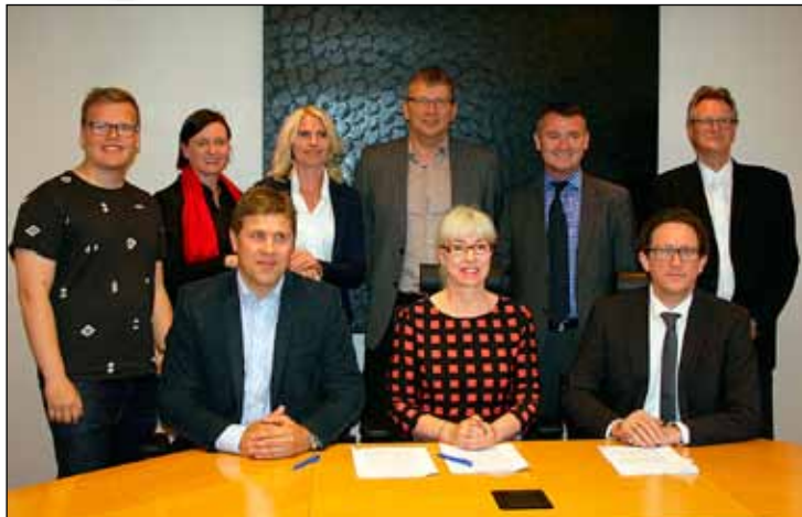
Nýkjörin bæjarstjórn Seltjarnarness ásamt Bjarna Benediktssyni fjármálaráðherra og Kristjáni Þór Júlíussyni heilbrigðisráðherra.