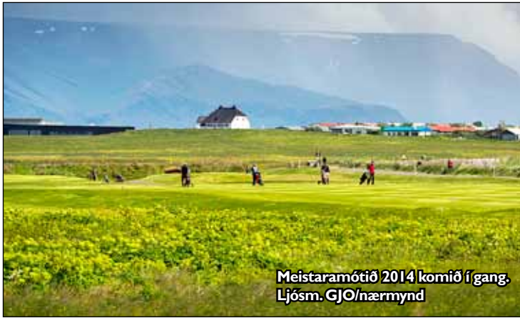
Meistaramótið 2014 komið í gang. Ljós. GJO/nærmynd