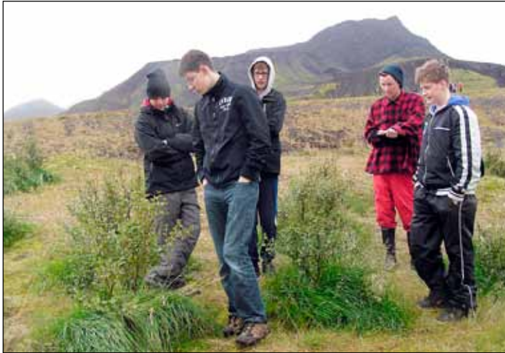
Nemendur huga að gróðri í Bolaöldu.

Nemendur Mýrarhúsaskóla hafa sett niður trjáplöntur og dreift lífrænum áburði á örfoka landsvæði á Bolaöldu frá árinu 2005. Þetta verkefni er unnið í samstarfi við samtökin Gróður fyrir fólk í landnámi Ingólfs eða GFF. Verkefnið kallast LAND-NÁM og er hluti af útiskóla sem samtökin starfrækja í samvinnu við grunn og framhaldsskóla. Verkefnið snýst um að endurheimta gróður á örfoka landi með skólaæskunni, með áherslu á að koma til birkiskógi að nýju.