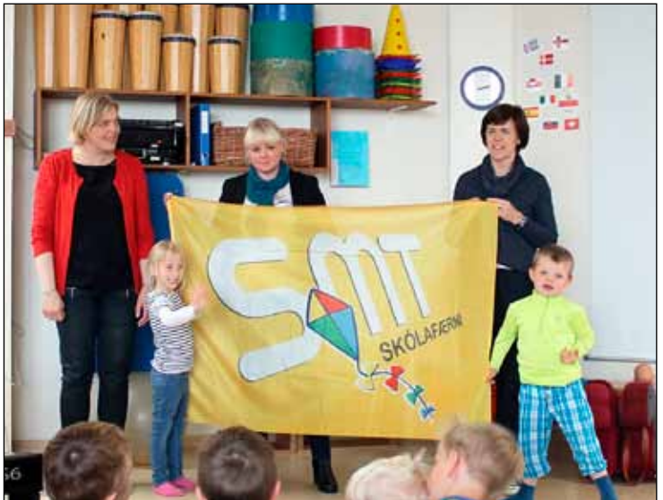
Fáninn er veittur sem viðurkenningu fyrir áralangt starf með börnum í SMT skólafærni.

Þetta er í fyrsta skipti sem heildstæð umferðaröryggisáætlun er gerð fyrir sveitarfélagið. Undanfarin ár hefur þó verið unnið markvisst að því í sveitarfélaginu að auka umferðaröryggi á Seltjarnarnesi t.d. með því að bæta öryggi á gönguleiðum skólalabarna og hraðatakmarkandi aðgerðum.