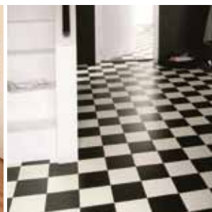
Forstofan einfaldara verður það ekki