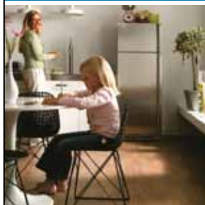
Eldhúsið hjarta heimilisins