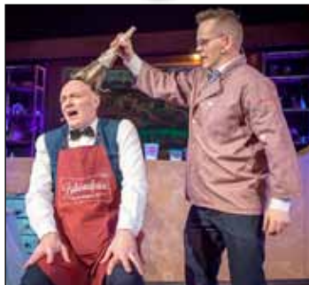
Hinir sívinsælu Gunni og Felix bregða á leik.