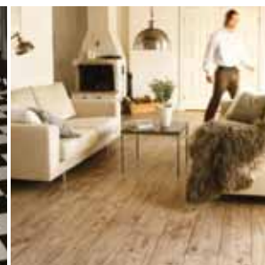
Stofan alltaf jafn heimilislegt