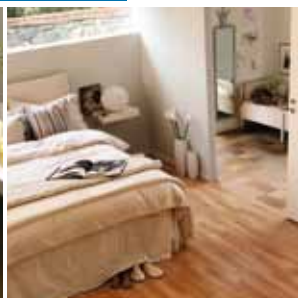
Svefnherbergið þægilegt andrúmsloft