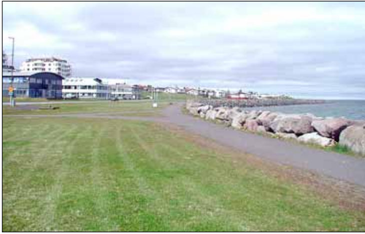
Þessa dagana er verið er að hanna hjólastíg við hlið göngustígar á Norðurströnd og áætlað er að hefja framkvæmdir í sumar.