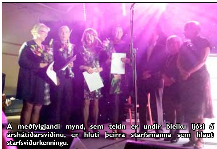
Á meðfylgjandi mynd, sem tekin er undir bleikju ljósi á árs hátíðarsviðinu, er hluti þeirra starfsmanna sem hlaut starfsviðurkenningu.