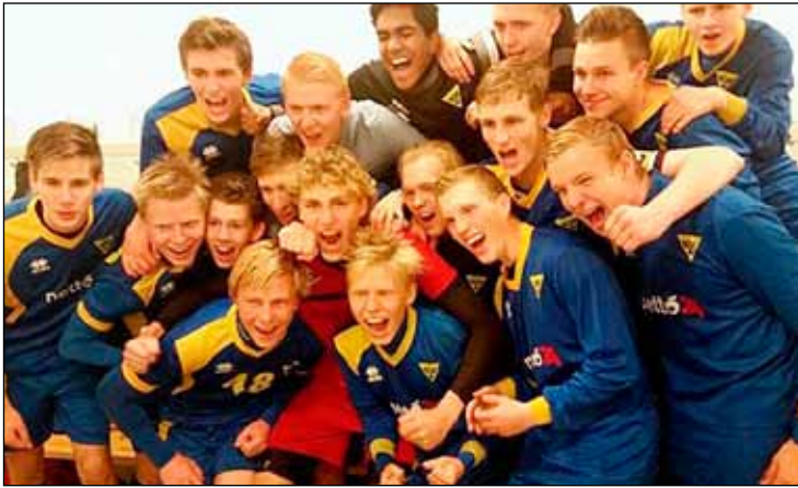
Strákarnir í 2. flokki ánægðir eftir að hafa tryggt sér sæti í B-deild.

toppað á réttum tíma en frábær frammistaða tryggði 3-2 sigur í stórskemmtilegum fótboltaleik. Ekkert mátti þó út af bregða í loka-leiknum við Snæfellsnes en hann vannst 2-1 og mikið fagnað í rútunni á leið heim frá Ólafsvík. Glæsilegu tímabili lokið hjá 2. flokknum en strákarnir urðu einnig Íslandsmeistarar innahúss og sigruðu B-deild Faxaflóamótsins í vor.