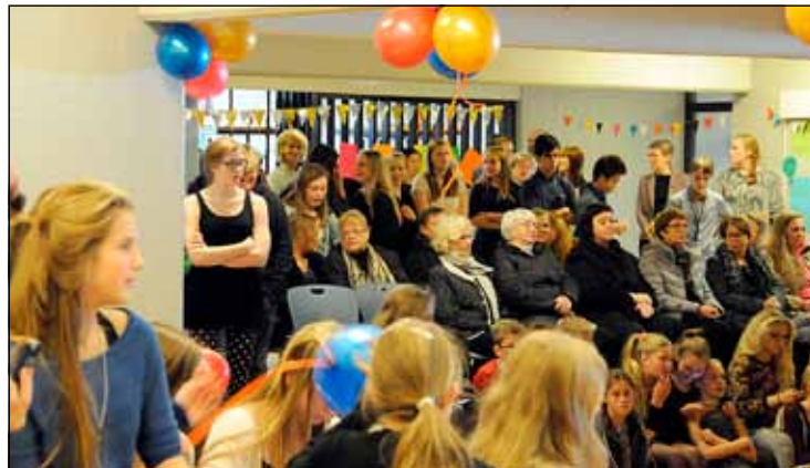
Mikið fjölmenni var á samkomunni sem haldinn var í Valhúsaskóla.