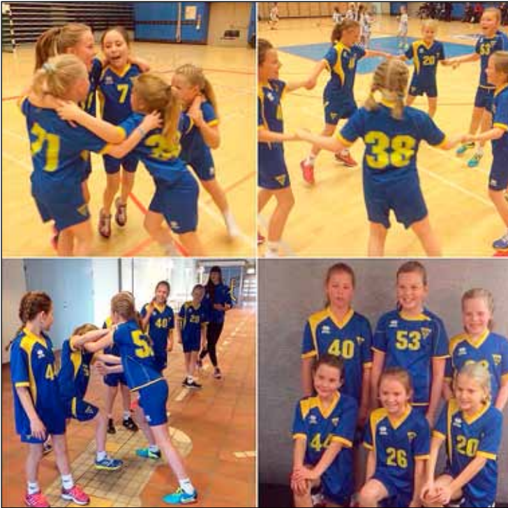
Skemmtilegar myndir af stelpunum í 6. flokki í handbolta sem hafa staðið sig vel í vetur.