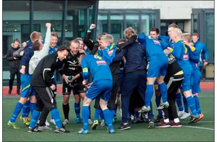
Gróttu mun leika í 1. deild árið 2015.

Meistaraflokkur karla í knattspyrnu tryggði sér á dögnum sæti í 1. deild Íslandsmótsins eftir að hafa hafnað í 2. sæti 2. deildar í sumar. Í byrjun ágúst var Gróttu með örugga forystu á liðin í 3. og 4. sæti og fátt virtist geta komið í veg fyrir að markmiði sumarsins yrði náð. Þá fór að síga á ógæfuhliðina, lykilleikmenn dattu út í meiðsli og veikindi og eftir fjögur töp í röð var spennan orðin gífurleg.