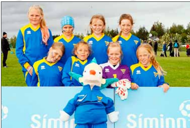
Gróttustelpur voru langflottastar.

Gróttustelpur áttum glæsilegan dag á Síamótinu í Kópavogi en það er langstærsta stelpufótbolta-mót landsins. Um 1.700 stúlkur frá 34 félögum tóku þátt að þessu sinni. Gróttu sendi eitt lið til leiks úr 7. flokki og tvö lið úr 5. og 6. flokki.