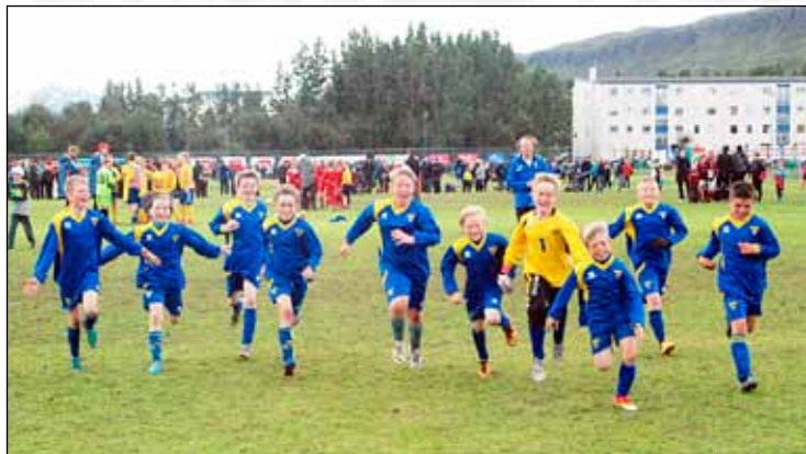
Strákarnir í 5. flokki fagnar að leik loknum.

Gróttustrákar voru í stuði á N1-mótinu en það er haldið í júlí ár hvert á Akureyri þar sem strákar í 5. flokki frá öllum landshornum eþja kappi. Gróttu sendi þrjú lið til leiks að þessu sinni.