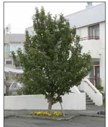
Tré ársins: Við Eiðistorg.