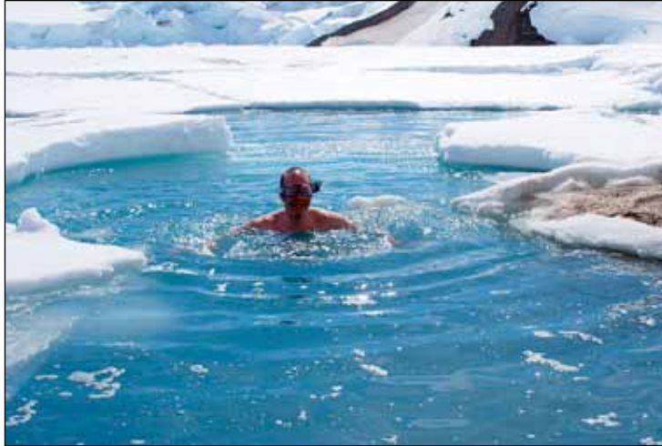
Ísleifur í sundi í vök í fjallavatni

„Þetta byrjaði með siglingaíþróttinni. Ég hóf ungur - eiginlega bara polli að stunda siglingar. Ég fór í þær af kappi. Þær urðu mín íþrótt og tómstundaiðja og ég ávann mér að geta talist afreksmaður. Á þeim tíma var ekki eins góður hlífðarfatnaður og er til í dag og maður var alltaf sullandi í vatni og oft blautur og