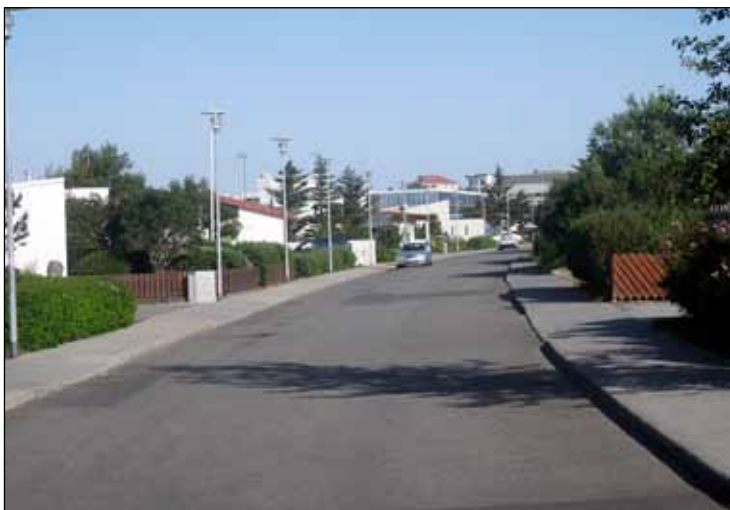
Gata ársins: Sæbraut.