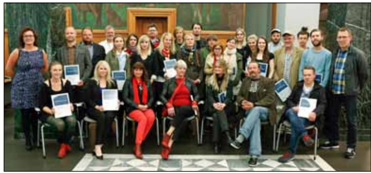
Fulltrúar allra þeirra verkefna sem hlutu styrk úr Menningarnæturpotti Landsbankans í ár.

Menningarnótt er miðborgarhátíð í orðsins bestu merkingu því sjaldan skryðist miðborg Reykjavíkur lítríkari og skemmtilegri skrúða en þennan dag. Allur miðbærinn iðar af margvíslegu lífi og listgreinar blandast saman á nýjan og spennandi hátt. Enda höfðar Menningarnótt til breiðari hóps fólks en flestar aðrar hátíðir, ekki nóg með að framboð af uppákomum af öllu tagi sé aldrei jafn mikið heldur er stemningin í miðbænum viðburður í sjálfu sér.