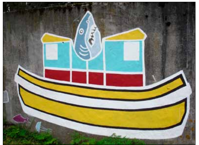
Það er sko ekkert krot sem má sjá á veggjum Klappar.