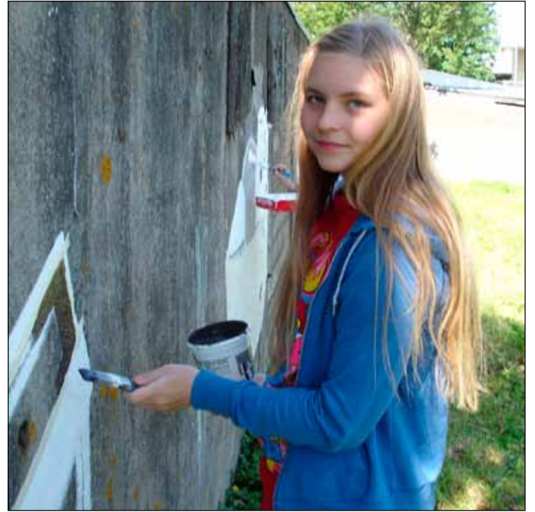
Áhuginn skín út úr andlitinu á þessari stúlku.