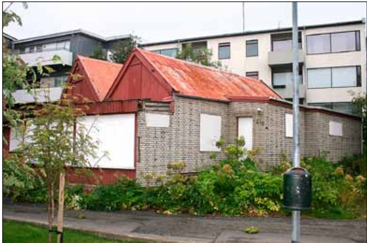
Stóra Sel, Holtsgata 41.b.

Úthlutun Reykjavíkurborgar á Stóra Seli, Holtsgötu 41.b, til áhugamannasamtakanna Veraldarvína hefur vakið hörð viðbrögð. Íbúar við Sólvallargötu telja afar mikilvægt að sjónarmið þeirra hvað varðar framtíð Stóra Sels séu gerð lýðum ljós. Í fundargerð borgarráðs frá 25. júlí sl. segir: „Lagt er til að samráð verði haft við eigendur íbúða og húsfélög sem liggja að Holtsgötu 41.b, Stóra Seli, og þeim kynntar fyrirætlunir Reykjavíkurborgar varðandi umrætt hús og lóð áður en ákvarðanir verða teknar um framtíð.“ Tillöggunni var vísað frá með fjórum atkvæðum gegn tveimur en borgarráðsfulltrúi Vinstri grænna sat hjá við afgreiðsluna.