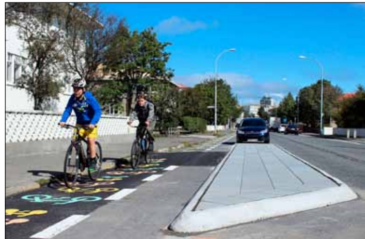
Götukafla á Hofsvallagötu hefur verið breytt til reynslu, m.a. fær hjóleiðafólk aukið rými við götuna.

Um mitt ár 2010 var búið að leggja 2,5 km af hólastígum og í lok ársins 2013 verða þeir orðnir 16 km. Á komandi árum er gert ráð fyrir að leggja 9,5 km af stígum til viðbótar. Hjólaborgin Reykjavík er áætluð sem var samþykkt árið 2010 og er hún er hluti í tillögu að aðalskipulagi Reykjavíkur þáttur í því að efla