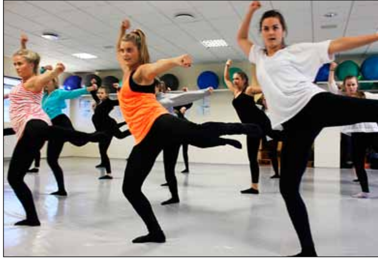
Glæsilegar danshreyfingar og hollar!

Dansskóli Birnu Björns býður upp á markvissa og vandaða kennslu þar sem grunnurinn og tæknin er jazzballett og kenndir margir dansstílar með. Þar má nefna jazzfunk, modernjazz, hiphop, freestyle, söngleikjadansa, bollywood o.fl. Markmiðið er að sem flestir nemendur kynnist sem flestum dansstílum en nái einnig árangri í góðri tækni. Hægt er að æfa 2 3 og 4x í viku og eru nemendur hvattir til að dansa oft- ar til að ná betri árangri. Metnaður og dansgleði er í fyrirrúmi og eru kennarar við Dansskóla Birnu Björns stoltir af glæsilegum dönsurum skólans. Skólinn býður