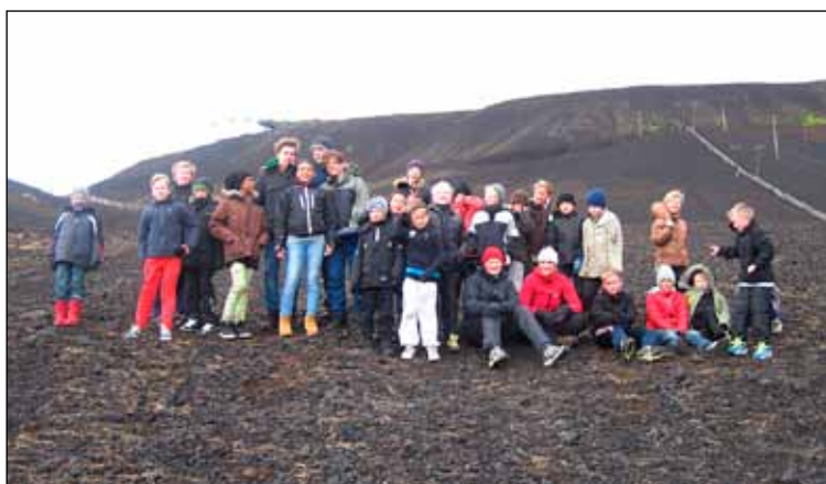
Fjölmennur hópur taekwondo iðkenda hjá KR í skemtilegri og jafnframt krefjandi útveru.

En það er fleira en þessi frábæri hópur sem er drífur taekwondo upp á við í KR því nú í lok ágúst hefjast byrjendaæfingar hjá nýjum barnahóp og hjá fullorðinshóp. Að sjálfsögðu bindum við vonir við að nýir hópar feti í fótspor brautryðjendahópsins og hafi gaman saman á æfingum. Starfsemin er sem sagt að stækka heilmikið við sig og er það í takt við gott gengi