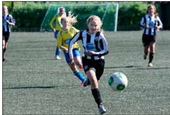
Frá leik KR gegn Grindavík sl. laugardag.

Næsti leikur liðsins er í kvöld, 22. ágúst, kl. 18:00 á KR-velli við Stjörnuna og síðan leikur við sameiginlegt lið Selfoss/Hamars/Ægis mánudaginn 26. ágúst kl. 18:00 á Selfossvelli. Leikurinn gegn Grindavík fór fram á lélegum gervigrasvellingum þrátt fyrir að ekkert væri um að vera á KR-svæðinu á sama tíma. Það þarf að sýna yngri flokkunum meiri virðingu og leyfa þeim að spila á grasi