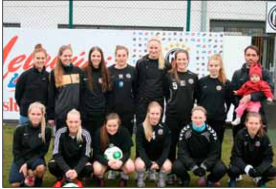
KR-liðið við upphaf mótsins í vor.

Síðasti leikurinn KR er gegn Fjölni laugardaginn 24. ágúst nk. kl. 14:00 á KR-vellinum. KR leikur við lið í 2. sæti B-riðils, sem er líklega ÍA og sigurvegarinn úr þeim leik leikur við sigurvegarann úr hinum úrslitaleiknum, sem er líklega á milli Grindavíkur og Fylkis. Liðin sem þann leik leika fara bæði upp í Pepsi-deild kvenna.