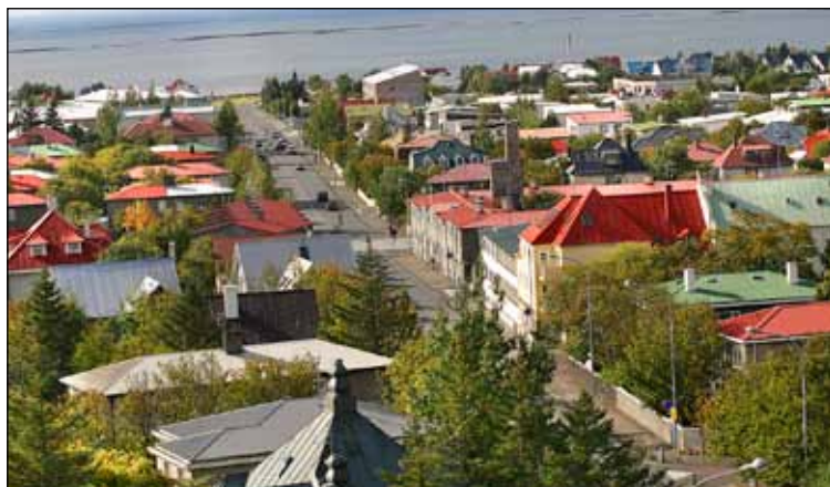
Vesturbærinn er stöðugt í þróun þótt byggð sé að mestu í fóstum skorðum.

Hverfisskipulagið er stærsta skipulagsverkefnið sem farið hefur verið í á síðari árum og það skipir miklu að íbúar séu vel upplýstir svo þeir geti tekið þátt. Verið er að vinna hverfisskipulag í átta borgarhlutum en Kjalarnes og Miðborgin eru undanskilin en verða tekin fyrir síðar. Hverfisskipulagi borgarinnar er ætlað það metnaðarfulla hlutverk að leggja grunn að þróun hverfa borgarinnar inn í framtíðina á