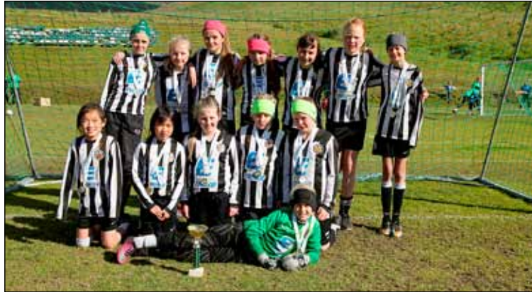
KR-stelpur í góðum gír á Siglufirði.

Stelpur úr A, B og C liði sam-einuðust og spiluðu sem B lið. Þær stóðu sig með þrygði og urðu Þæjumótsmeistarar í flokki B-liða ásamt því að komast í úrslit í bikarkeppni Þæjumótsins. Þar mættu þær A liði KA sem eftir hörkuleik urðu bikarmeistarar.