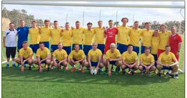
Meistaraflokkur karla í knattspyrnu á Spáni.