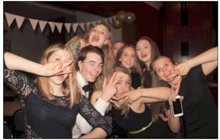
Í stuði á árshátíð Való.

Blómastofan fór þaðan en nú hafa nýir eigendur hug á að koma því í not á ný. Einkum er rætt um kaffihús enda var kaffihús starfrækt í Blómastofunni á sínum tíma.