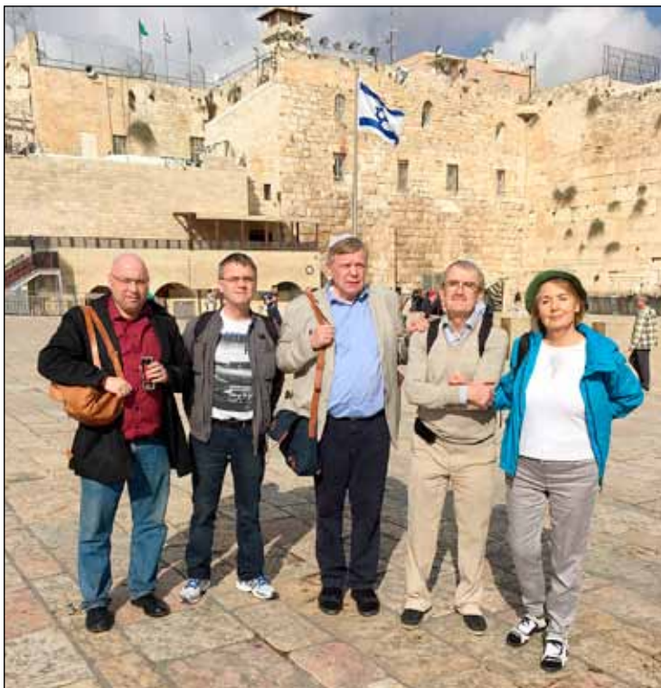
Myndin er tekin við grátmúrinn í Jerúsalem með nokkrum íslenskum félögum í nóvember á liðnu ári.

og í Danmörku. Þótt mér liði vel þar leitaði alltaf á mig að eitthvað vantaði. Það var fjallasýnina sem ég saknaði.“