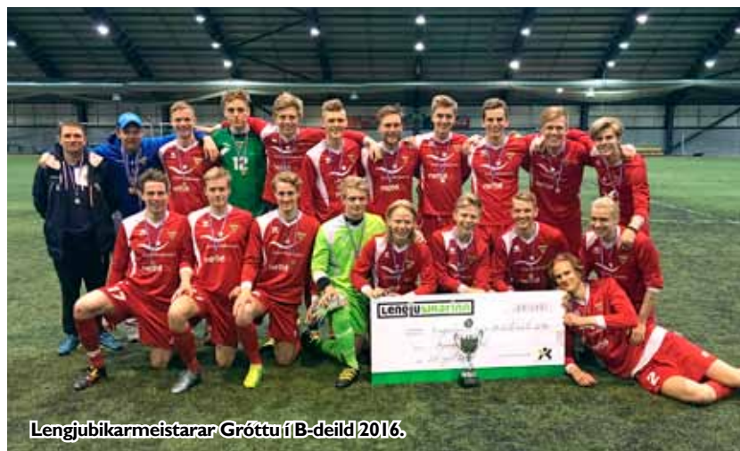
Lengjubikarmeistarar Gróttu í B-deild 2016.