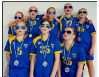
6. flokkur kvenna yngri.

Stelpurnar í 6. flokki kvenna í handbolta hafa lokið keppni á þessu tímabili og náð frábærum árangri. Flokkinn skipa 17 flottar stelpur fæddar 2004 til 2005 og þær æfa þrisvar í viku. Góð liðsheild, leikgleði og metnaður við æfingar hefur verið í fyrirrúmi í vetur og það hefur leitt til þess að stelpurnar hafa tekið miklum framförum og náð frábærum úrslitum á mótum vetrarins.