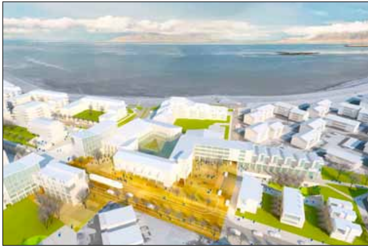
Hugmynd Kanon arkitekta að Eiðistorgi framtíðarinnar.

Í umræðum um húsnæðismál komu þau sjónarmið fram að fjölga bæri íbúum á Seltjarnarnesi en einnig þau að best væri að halda í horfinu. Þeir sem töluðu fyrir fjölgun nefndu að hætta væri á stöðnun eða afturför og að grundvöllur fyrir sterku skóla- og félagsstarfi myndi rýrna án nýrra íbúa. Aðrir bentu á að styrkur Seltjarnarness fælist einkum í fámenni og nálægð við stjórnsýslu bæjarfélagsins. Bent var á að nýjar íbúðir ættu að vera í minni kantinum – tveggja til þriggja herbergja íbúðir á bilinu 60 til 100 fermetra. Einnig komu þau sjónarmið fram að hæð bygginga á Seltjarnarnesi ætti að miðast við tvær til þrjár hæðir og einnig að nokkru leyti við þarfir