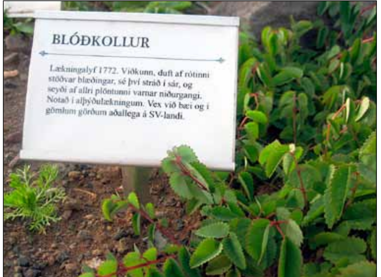
Blóðkollur eða Sanguisorba Officinalis er ein af lækningaplöntunum sem danskir lyfsalar áttu að rækta og eiga í apótekum sínum árið 1772.

... fréttáannáll 2015 frá Urtagarðinum í Nesi