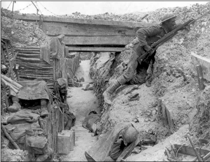
Skotgrafahernaðurinn varð tákn heimsstyrjaldarinnar fyrri. Bresk skotgröf í Norður-Frakklandi í júlí 1916. Einn hermaður stendur vaktina, hinir sofa.