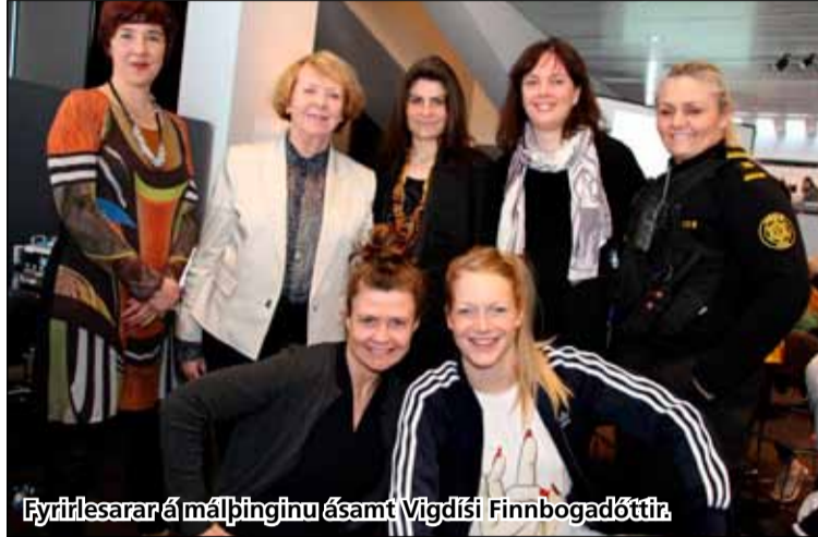
Fyrirlesarar á málþinginu ásamt Vigdísi Finnbogadóttir.