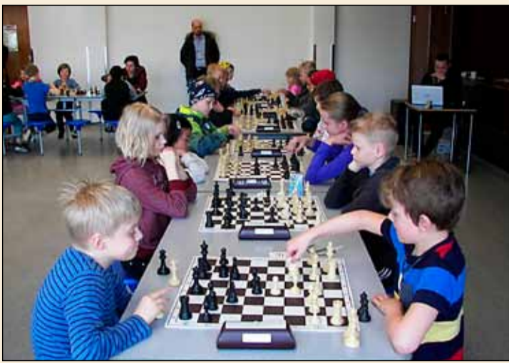
Setið að tafli í Hagaskóla.