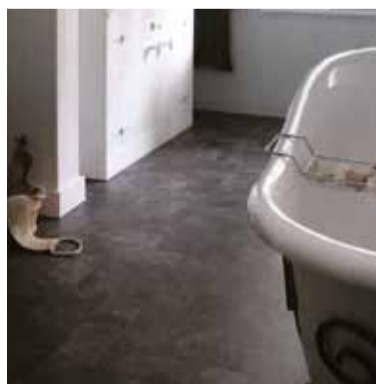
Baðherbergið hlýtt og mjúkt undir fæti