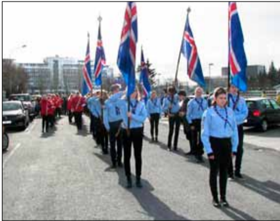
Hefðbundin skrúðganga fór fram frá Melaskóla að Frostaskjólum þar sem skátar settu svip á gönguna.