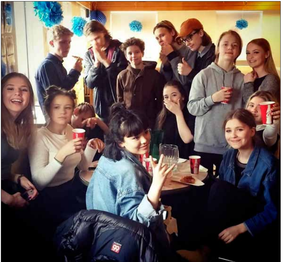
Hressir unglíngar úr félagsmiðstöðinni Frosta á leið á Samfestinginn 2016.