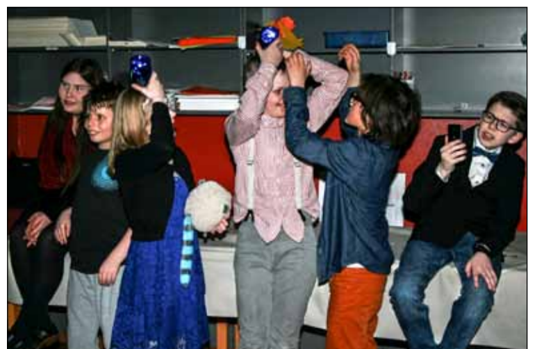
Gleði og gaman á árshátíð Hofins.

meira út í ferska loftið og því eru hjá unglíngunum okkar á skemmtilegir tímar framundan næstu mánuðum.