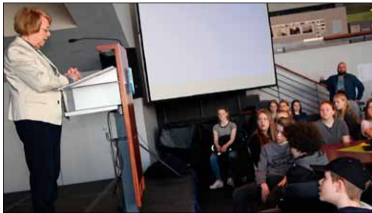
Vigdís Finnbogadóttir fyrrverandi forseti setti málþingið.