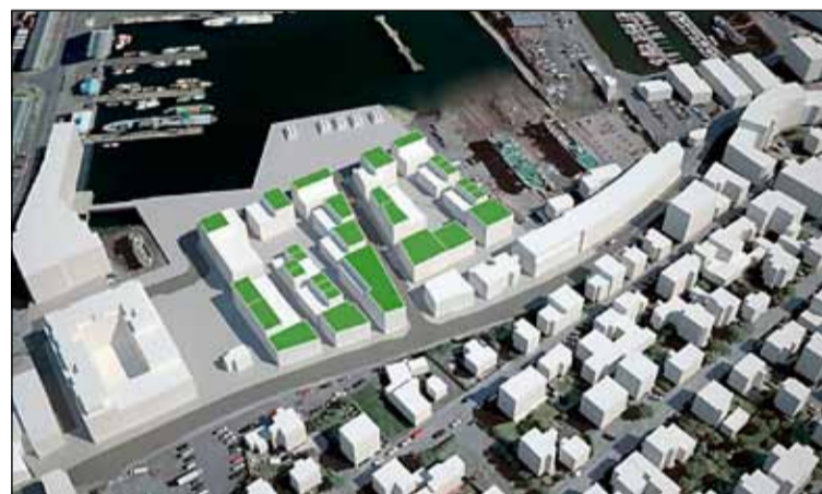
Líkan sem sýnir staðsetningu íbúðanna.