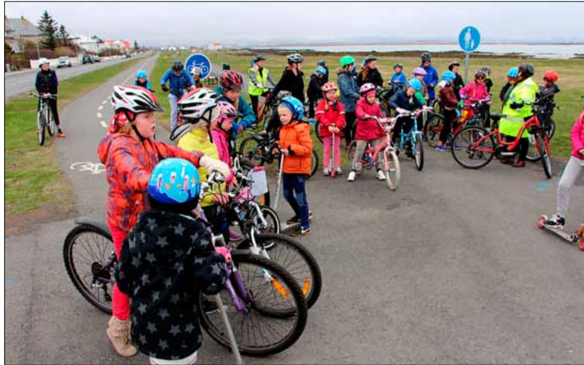
Nemendur á öllum aldri í hjólréiðaferð á bókalausadeginum í Grandaskóla um daginn.