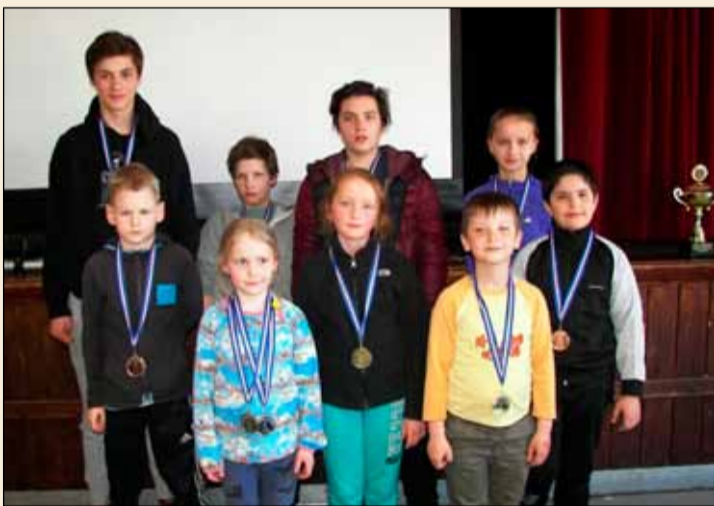
Verðlaunahafar á mótinu.

sendir flesta þátttakendur og að þessu sinni var það Álfhólsskóli sem vann þetta árið, líkt og í fyrra. Mótið þykir afskaplega gott og vel heppnað og er gaman að sjá að krakkar eru að koma ár eftir ár, en þetta er fjórða árið í röð sem þetta er haldið. Melabúðin er Styrktar- aðili mótsins.