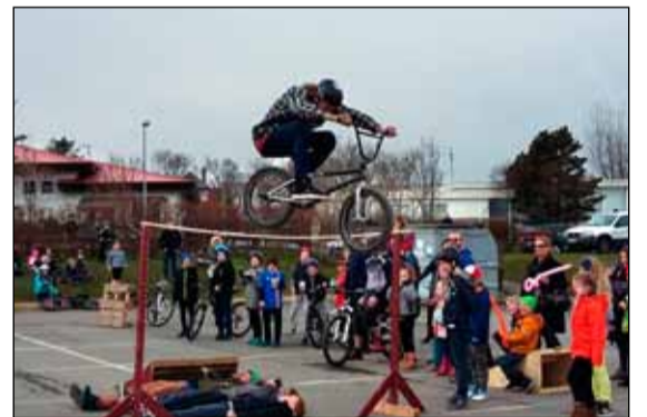
Reiðhjól koma gjarnan við sögu á sumardaginn fyrsta. Þessi ungi maður er að stökkva yfir myndun á reiðhjólum.

Fræðslufundur Húsverndarstofu 18. maí kl. 16 - 18