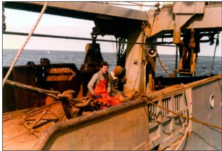
Ellert um borð í togara út á halamiðum 1978. Skipið hét Bjarni Benediktsson.