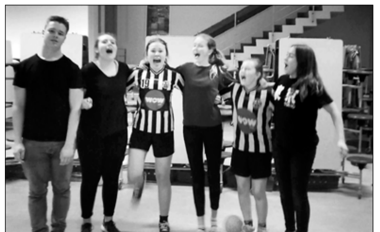
Sigurvegarar Dodgeball-móts Frosta

Þessa dagana eru unglíngarnir í hjólabrettaklúbb Frosta á fullu að undirbúa hjólabrettamótið Skötuveisluna sem haldið verður á Ingólfstorgi þann 27. maí og má búast við miklu fjöri í kringum það. Með hækandi sól færirst starfsemi félagsmiðstöðvanna