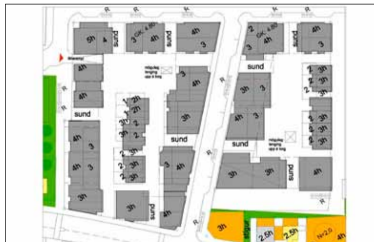
Hér má sjá staðsetningu hverrar byggingar fyrir sig.