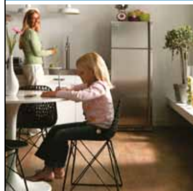
Eldhúsið hjarta heimilisins