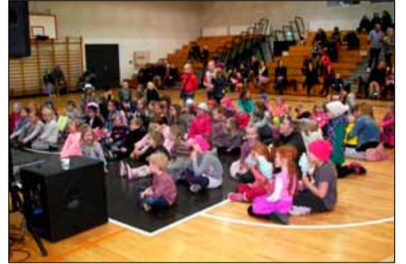
Sungið á inniskemmtun í KR-heimilinu.

Dagskráin var nokkuð hefðbundin, skrúðganga frá Melaskóla að Frostaskjólum þar sem fór fram skemmtileg dagskrá, úti og inni. Sem dæmi má nefna söng frá Öldu Dís, hæfileikakrakkar úr Vesturbænum, hjólaleikni o.m.fl. Einnig var boðið uppá hjólaskoðun sem margir nýttu sér. Líkt og undanfarin ár var skipulagið í höndunum á starfsmönnum Frostaskjólis, en það voru margir sem komu að dagskránni og má t.d. nefna KR, Vesturgarð, Skátafélagið Ægisbúa, Reykjavíkurborg o.fl.