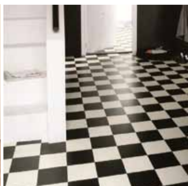
Forstofan einfaldara verður það ekki