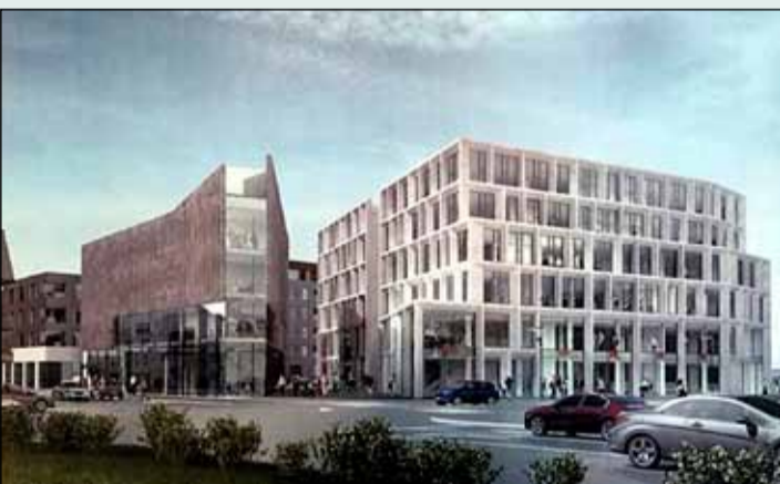
Fyrirhugaðar byggingar á Hafnartorgi.

Arcus ehf, sem er systurfélaga ÞG Verks hefur keypt byggingarreitinn á milli Lækjargötu og Tollhússins og þróunarfélaginu Reykjavík Development áður Landstólpar þróunarfélag. Samkvæmt heimildum er kaupverð um fjórir milljarða króna.