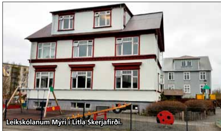
Leikskólanum Mýri í Litla Skerjafirði.

Fyrir skömmu var foreldrum leikskólanna á Mýri tilkynnt af skóla- frístundaráði Reykjavíkurborgar að framtíð skólans var til umræðu. Bent var á að skólastjóri væri að láta af störfum á komandi sumri og einnig útlit fyrir að einungis um 30 börn verði í skólanum á komandi vetri og ástæðan sögð að útlit sé fyrir að börnum sé að fækka í Vesturbænum. Þá hefur einnig komið fram að verið sé að leita að framtíðarhúsnæði fyrir leikskólann Ós við Bergþórugötu en hann er