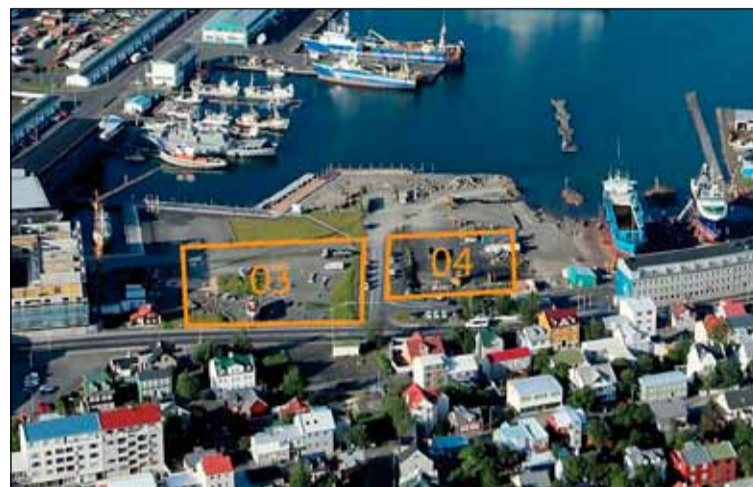
Hér má sjá staðsetningu lóðanna við gömlu höfnina.

Uppbygging í Vesturbugt er liður í þeirri stefnu að auka byggð í nálægð við vinnustaði, verslun og þjónustu miðborgarinnar. Deiliskipulag fyrir Vesturbugt gerir ráð fyrir vistvænum áherslum og vönduðum almenningsrýmum sem styðja vel við mannlíf og útivist. Torg og stígar innan lóða verða hluti almenningsrýmis. Gróður er hluti af frágangi þeirra og hitalögn verður undir göngusvæðum. Áherslur Reykjavíkurborgar í uppbyggingunni eru einnig að styðja við fjölbreytta byggð og gerir borgin ráð fyrir að kaupa um 74 íbúðir af íbúðunum 170 - 176 samkvæmt tilboði bjóðanda. Til að ná fram markmiðum Reykjavíkurborgar um blandaða íbúðabyggð er gerð krafa um að 10% íbúða verði leiguíbúðir. Af hálfu Reykjavíkurborgar er lögð áhersla á að ná fram fjölbreyttu yfirbragði byggðarinnar og í deiliskipulagi eru gerðar kröfur um hönnun með það í huga að fá fram fjölbreytileika í útliti húsa. Dagur B. Eggertsson, borgarstjóri segir ánægjulegt að þessum áfanga skuli vera náð. Vesturbugtinn sé áhugaverður staður og mikilvægt að vel verði staðið að uppbyggingu. Dagur kveðst vilja sjá áhugaverða blöndu af íbúðarhúsnæði, atvinnuhúsnæði og skapandi lausnum og góða hönnun og kveðst sannfærður um að þetta lykilverkefni eigi eftir að vekja áhuga og athygli góðra þróunar- og uppbyggingaraðila.