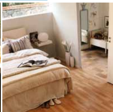
Svefnherbergið þægilegt andrúmsloft