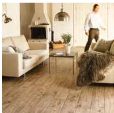
Stofan alltaf jafn heimilislegt