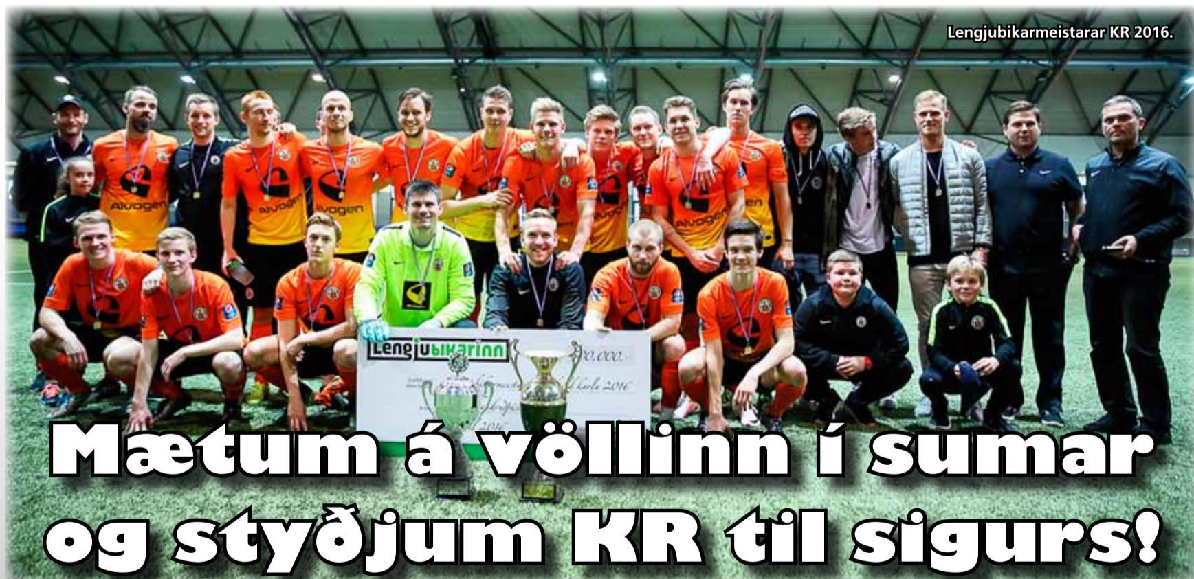
Lengjubikarmeistarar KR 2016.

Sálumessa eða Requiem er síðasta verk sem Mozart vann að en það var ófullgert er hann lést árið 1791. Af öllum þeim fjölda sálumessa sem samdar voru á 18. öld nýtur verk Mozarts einnar mestrar hylli. Að margra mati nær list tónskáldsins hápunkti sínum í verkinu og er samspil texta og tónlistar sérstaklega eftirtektarverð. Eftir andlát Mozarts fól ekkjan, Constanze, Franz Xaver Süßmayr samstarfsmanni og nemenda Mozarts að fullgera verkið.