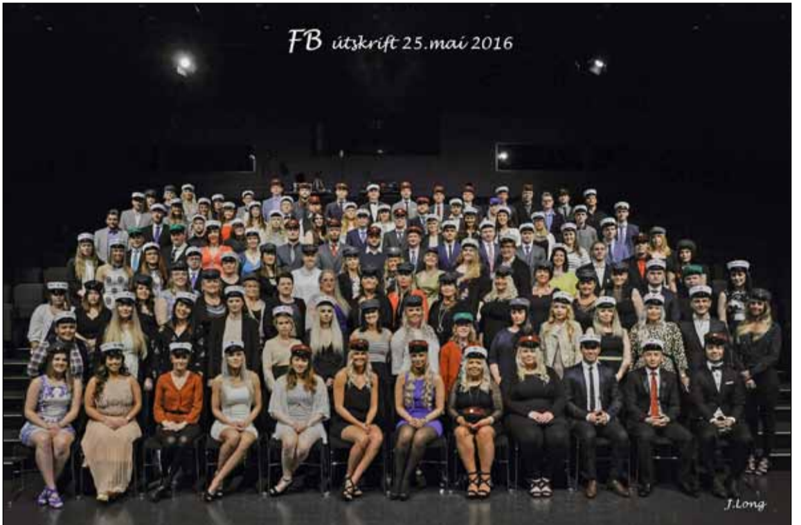
Útskriftarhópurinn í Hörpu.