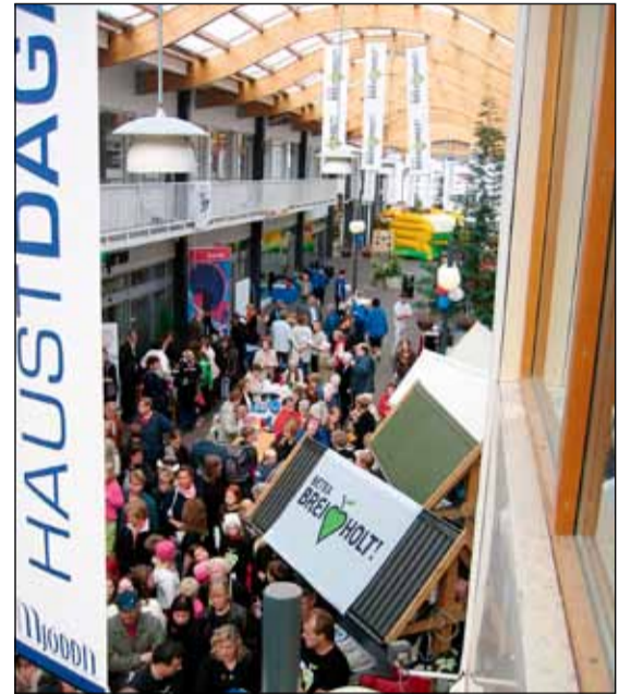
Myndin var tekin af fjölmenni í Mjóddinni á Breiðholtsdegi fyrir nokkrum árum.

Í Breiðholti er öflugt hverfastarf með áherslu á samskipti kynslóðanna og fjölbreytni mannlífsins. Alls eru 450 milljónir til framkvæmda á þeim hugmyndum sem koma inn í ár og er það veruleg hækkun frá fyrri árum þegar 300 milljónir voru til ráðstöfunar. Af þeim renna 69.957.904 kr. til