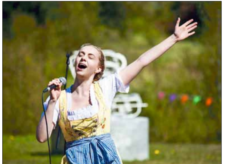
Tónlistartriði frá Breiðholt Festival á síðasta ári.

Á hátíðinni er sjónum því beint að þeirri listsköpun og menningarlífi sem fer fram í Breiðholti, með þátttöku listamanna úr ýmsum listgreinum sem tengjast hverfinu. Auk þess er boðið upp á fjölbreyttar listasmiðjur fyrir gesti hátíðarinnar. Framleiðandi hátíðarinnar er plötuútgáfan Bedroom Community, sem fagnar einmitt 10 ára afmæli í ár. Eitt af yfirmarkmiðum hátíðarinnar er að vekja athygli á þeirri fjölbreyttu og frambærilegu listsköpun sem tengist hverfinu. Einnig viljum við stuðla að