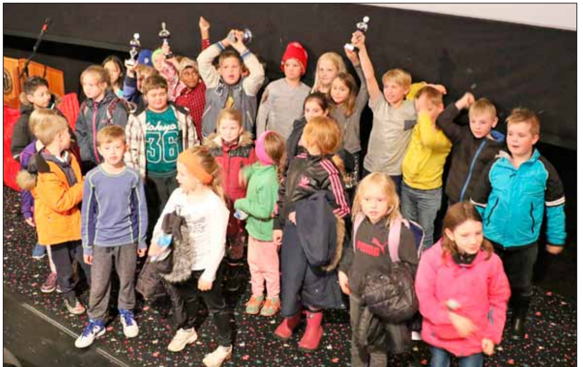
Sigurveggarar Filmunnar 2016.

Frístundamiðstöðin Miðberg hélt sína árlegu kvikmyndahátíð, Filmuna þann 27. maí síðast liðinn í samvinnu við Sambíóin Álfabakka og Barnamenningarhátíð Reykjavíkur. Þetta er í fjórða sinn sem hátíðin er haldin og voru aðstandendur hennar virkilega ánægðir með árangurinn. Myndirnar eru búnar til af börnunum sjálfum, þau skrifa handrit, leika og taka þátt í eftirvinnslu undir leiðsögn fagmenntaðra starfsmanna í kvikmyndagerð. Mikil áhersla er lögð á að komu barnanna í gerð myndanna og eru verkefni fjölbreytt og krefjast mismunandi hæfileika og áhugasviðs.