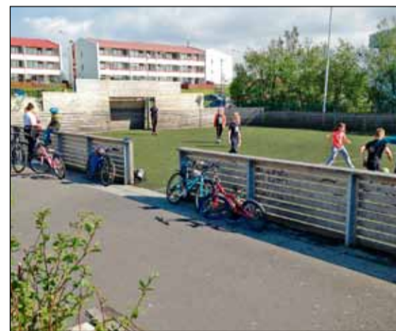
Frá íþróttaæfingum Samspils á liðnu ári