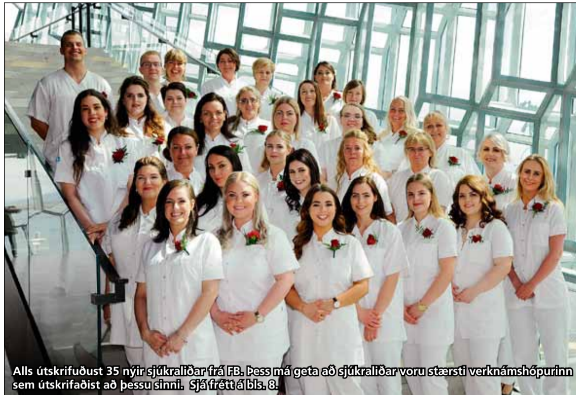
Alls útskrifuðust 35 nýir sjúkraliðar frá FB. Þess má geta að sjúkraliðar voru stærsti verknámshópurinn sem útskrifaðist að þessu sinni. Sjá frétt á bls. 8.