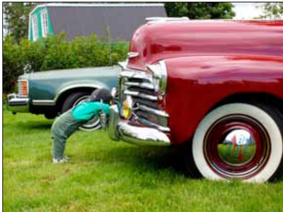
Gömlu bílarnir vekja jafnan athygli ungra sem aldinna.