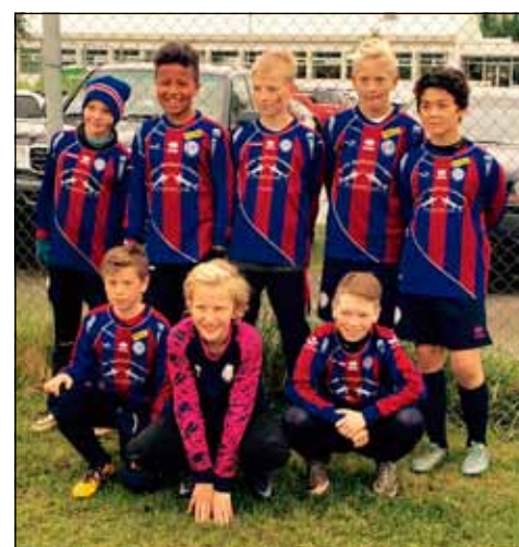
Eitt liða 5. flokks sem tók þátt í N1 mótinu. Flottir strákar á ferð.