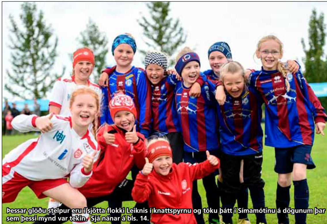
Þessar glöðu stelpur eru í sjötta flokki Leiknis í knattspyrnu og tóku þátt í Símamótinu á dögnum þar sem þessi mynd var tekin. Sjá nánar á bls. 14.