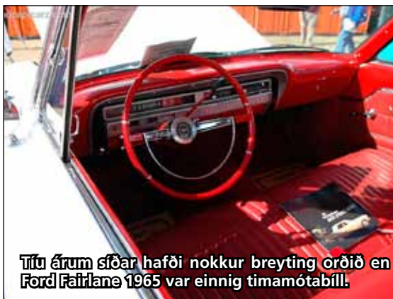
Tíu árum síðar hafði nokkur breyting orðið en Ford Fairlane 1965 var einnig tímamótabíll.