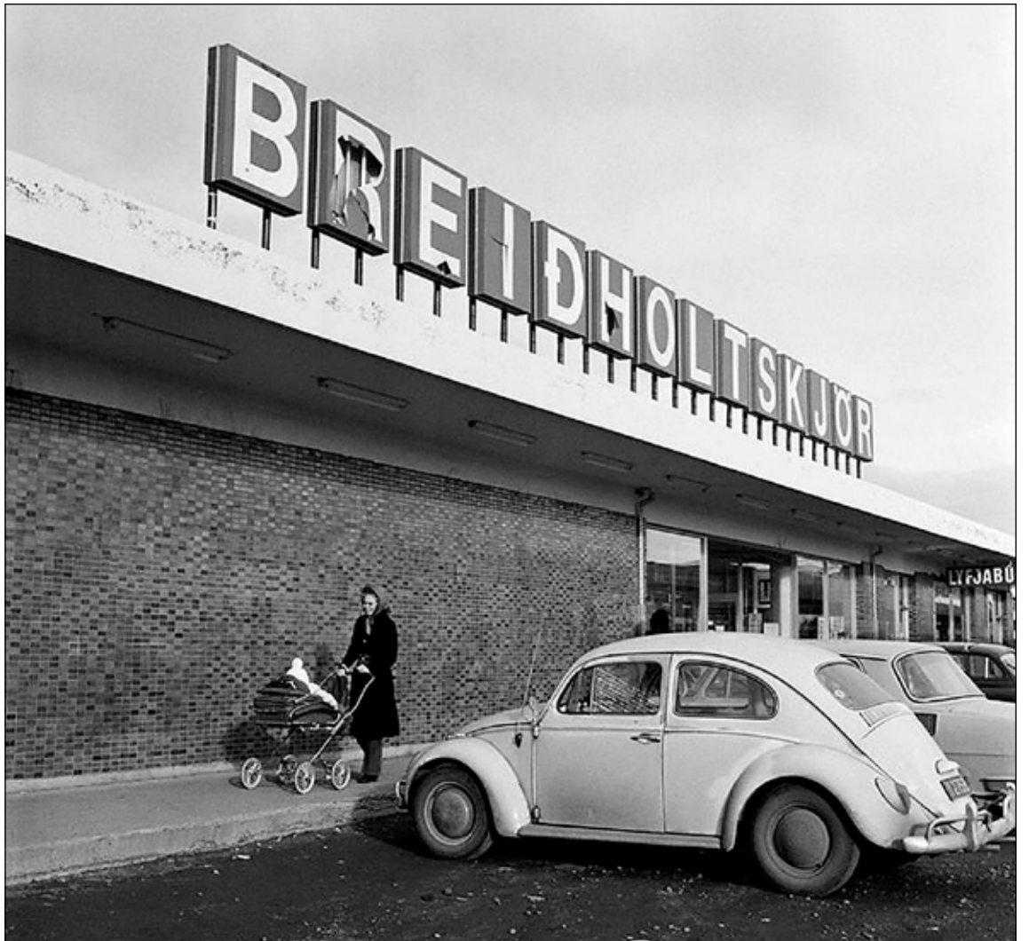
Breiðholtskjör var ein fyrsta verslunin í hinu nýja Breiðholti. Þannig var umhorfs við Arnarbakkann undir lok sjöunda áratugarins.

í sögu byggða á Íslandi. Nú eru malarslóðarnir löngu horfnir og Breiðholtið orðið með grónustu byggðum hér á landi.