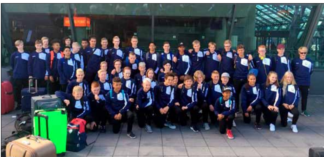
Þriðji og fjórði flokkur Leiknis á leið til Svíþjóðar til að taka þátt í Gothia Cup 2016. Ansi stór hópur sem félagið er stolt af.

5., 6. og 7. flokkur stúlkna hefur nýlengi þátttöku í Síamótinu og var það vel heppnað og skemmtilegt fjögurra daga mót sem haldið var í Kópavogi. Síðast liðinn laugardag héldu svo 45 iðkendir 3. og 4. flokks af stað til Gautaborgar ásamt þjálfurum og fararstjórum. Í Gautaborg er stærsta fótboltafót mót yngri flokka á heimsvísu, Gothia Cup. Þar taka 1600 lið þátt frá 80 löndum. Leiknir teflir fram fjórum liðum á mótinu en því lýkur laugardaginn 23. júlí. Verður gaman að fylgjast með en á heimasíðu mótsins gothiacup.se er hægt að sjá leiki í beinni útsendingu.