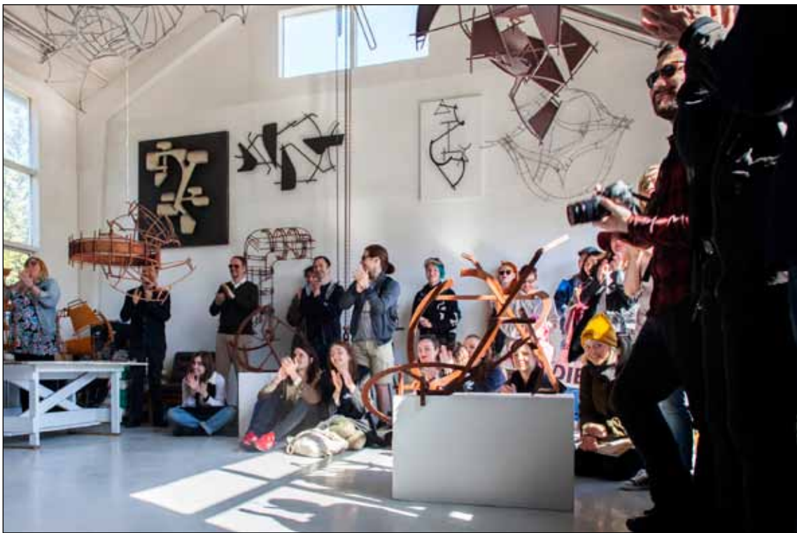
Tónleikar í hljóðstúdíói.