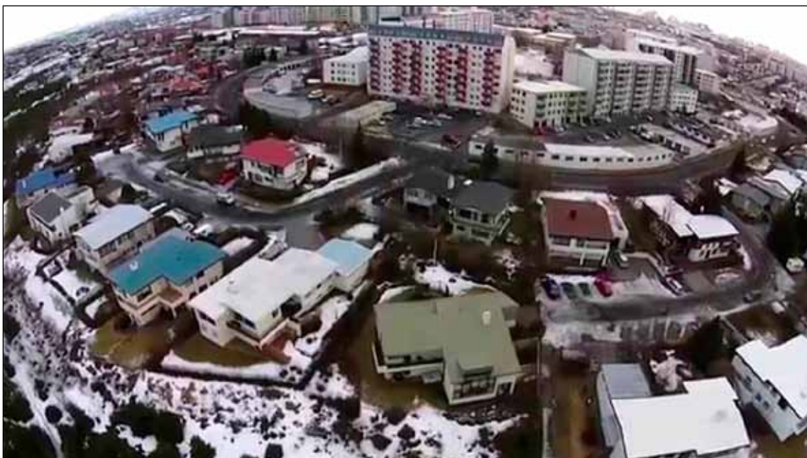
Hólahverfið í Breiðholti.

Þetta er um 16% fjölgun frá fyrra ári þrátt fyrir að færri einstaklinga séu í þessum árgangi að þessu sinni. Búið að innrita 228 eldri nemendur til náms við skólann þannig að alls hefja 435 nýir nemendur nám við skólann í haust.