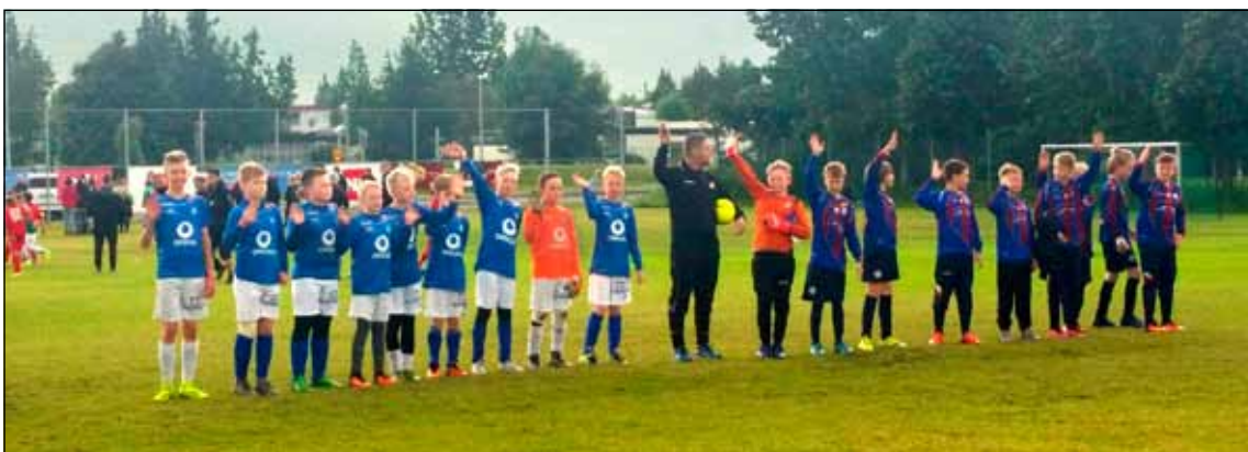
Á N1 mótinu hefst hver leikur með kveðju.