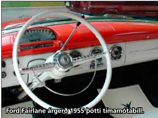
Ford Fairlane árgerð 1955 þótti tímamótabíll.

Heimsókn á Árbæjarsafni gefur fólki kost á að upplifa ferðalag aftur í tímann og á forn bíladeginum mátti sem jafnan sjá marga glæsifarkosti fyrri tíðar. Þrátt fyrir alla hönnun og þróun sem orðið hefur í framleiðslu bíla á liðinni öld og það sem af er þessari þá halda þessir fornu fákar persónuleika sínum en á þessum tíma var oft lögð meiri áhersla á útlitið en ef til vill innihaldið. Einkum eru það bílar fyrri tíðar frá Bandaríkjunum sem glansa af glæsileika og vekja jafnan forvitni hvar sem þeir fara.