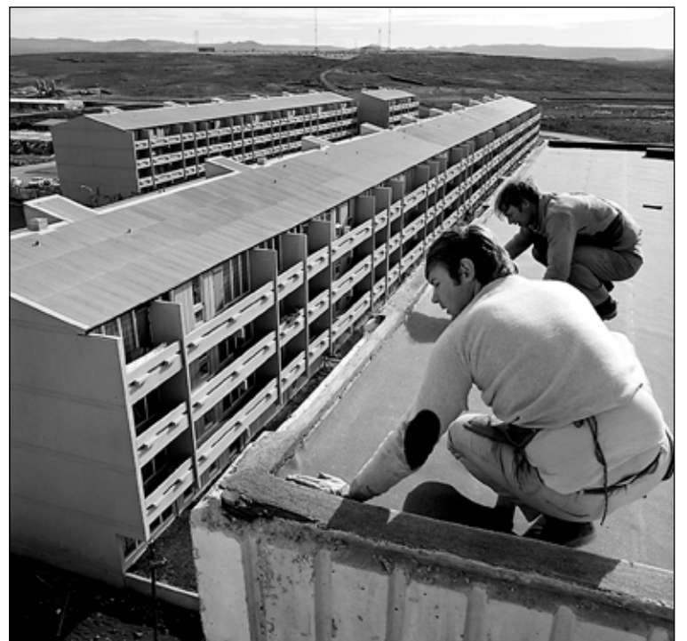
Ungir menn við byggingavinnu í Breiðholti í kringum 1970.

Eins og titt er um nýjar byggðir var engin kirkja í Breiðholti um fyrstu. Breiðholtskirkja í Mjóddinni var byggð fyrst þriggja kirkna og þótti mjög nýstárleg. Hún var stundum kölluð Indíánatjaldið vegna byggingarlagsins á árdögum Breiðholtsins.