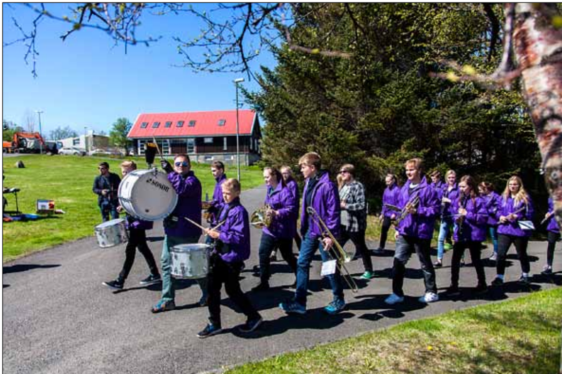
Lúðrasveit leikur á göngu á Breiðholt Festival á liðnu ári.