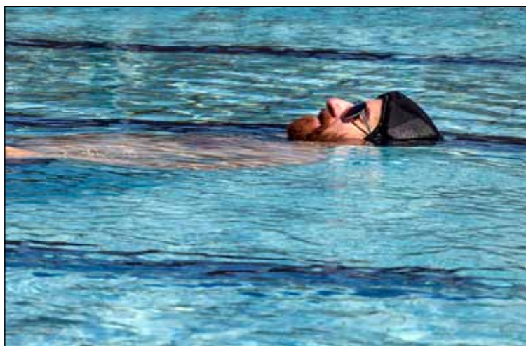
Hljóðinnsetning í Ölduselslaug.