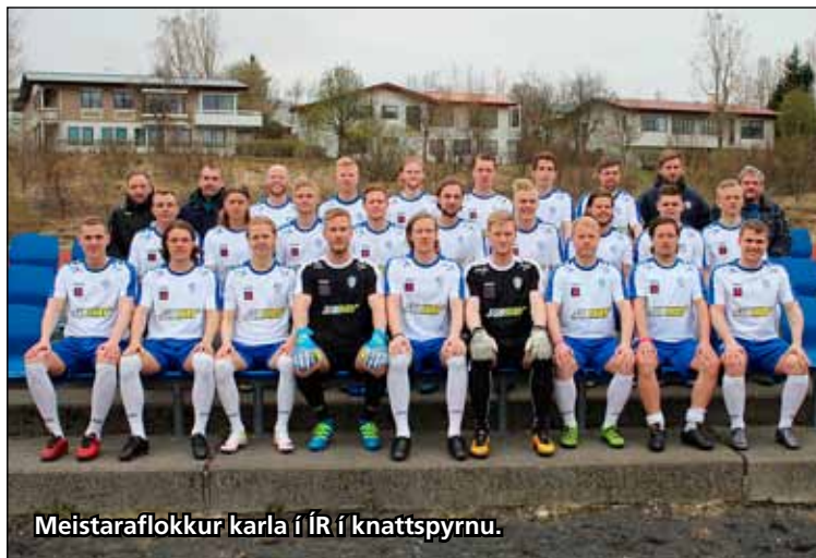
Meistaraflokkur karla í ÍR í knattspyrnu.

Meistaraflokkur kvenna í knattspyrnu er í efsta sæti 1. deildar í A-riðli með 22 stig eftir 8 leiki og unnu þær síðast Víkinga frá Ólafsvík á ÍR-vellinum 2-0.