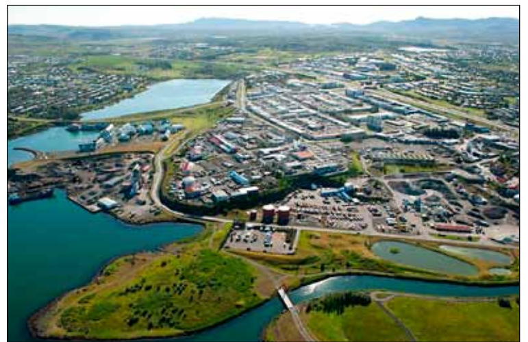
Séð yfir Ártúnshöfðann. Bryggjuhverfið og Gullinbrúin til vinstri og lengra til vinstri má sjá yfir í Grafarvoginn.