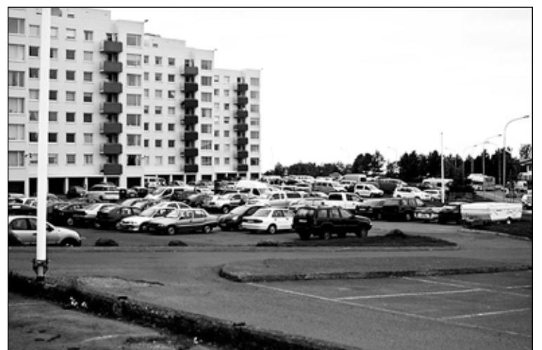
Stórhýsi einkenndu hluta Efra Breiðholtsins og hafa slík hús ekki risið hér á landi – hvorki fyrir eða síðar.