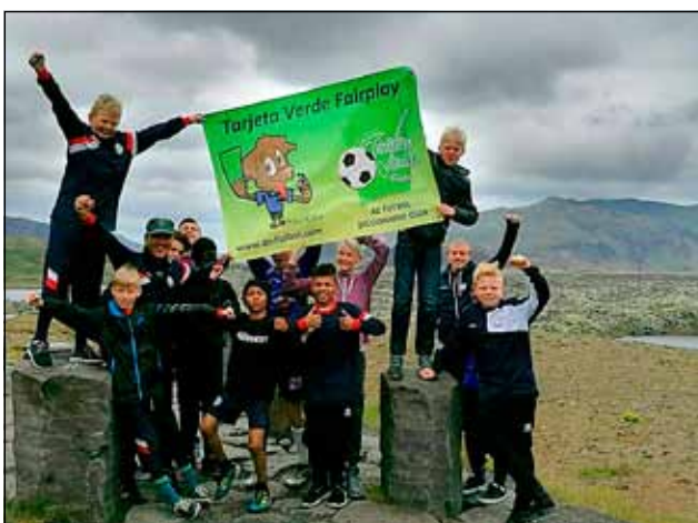
Þessi mynd lýsir vel stemningunni í 4. flokki karla. Þar er lögð áhersla á græna spjaldið sem er gefið fyrir góða framkomu. Flokkurinn fór á Snæfellsnes og er myndin tekin á leiðinni þangað.