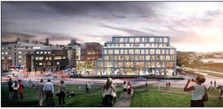
Hér mun miðborgarverslun H&M verða staðsett í framtíðinni.