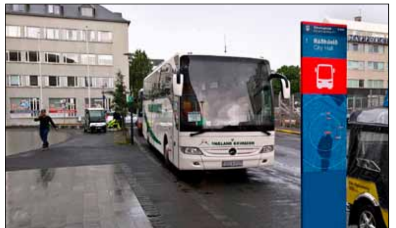
Ein stoppustöðvanna fyrir stóru bílana er við Ráðhús Reykjavíkur.

Markmiðið með nýju stæðunum er að vernda íbúabyggð fyrir óþarfa umferð en um leið auka þjónustu við rútufrirtækin og gistaðaði innan þeirra svæða sem takmarkanir eru á akstri stórra bíla. Rútubílastæðin eru merkt með númerum og heitum til að draga úr mögulegum misskilningi. Staðsetningar stæðanna má sjá á korti á vef Reykjavíkurborgar og þær hafa einnig verið settar