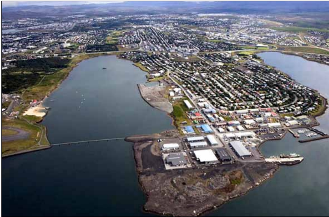
Kársnesið er vestasti hluti Kópavogs en þar myndi umrædd brú koma að landi.

Ákveðið hefur verið að skipa í starfshóp til að sjá um gerð umhverfismats og deiliskipulags vegna brúar yfir Fossvog á milli Reykjavíkur og Kópavogs. Tillögur um þetta voru samþykktar á fundum borgarstjórnar og bæjarstjórnar Kópavogs í júnímánuði en hópurinn verður skipaður tveimur fulltrúum frá hvorum aðila auk tveimur frá Vegagerðinni.