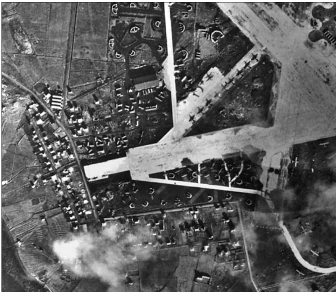
Tilkoma Reykjavíkflugvallar sem var byggður sem breskur herflugvöllur hafði mikil áhrif á byggðina í Skerjafirði. Þessi mynd er frá stríðsárunum 1939 til 1945.

sem í dag er gamla höfnin í Reykjavík breytti áformum Einars og upphaf heimsstyrjaldarinnar frá 1914 til 1918 kom þar einnig við sögu og lögðust áform um Skerjafjarðarhöfn þá alfarið af.