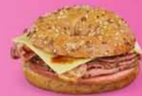
Naut, skinka og BBQ