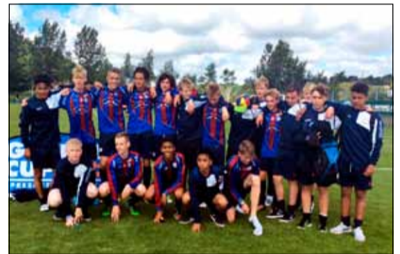
Leiknisstrákar í 16 ára liðinu.