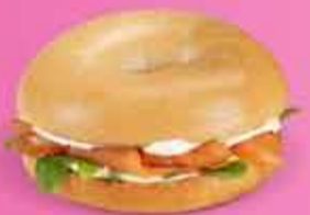
Lax og rjómaostur