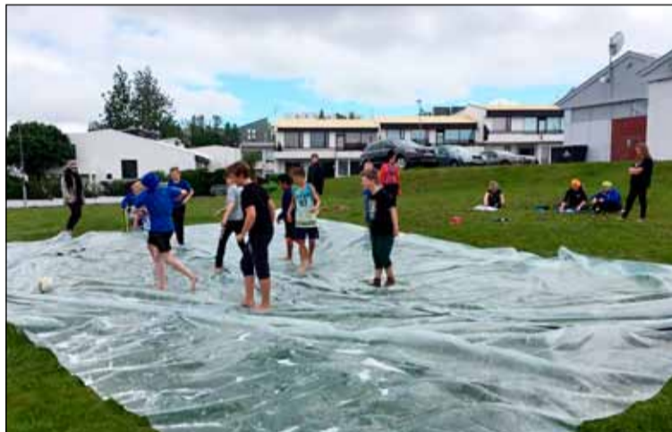
Sápubolti í 10 11.

leiðbeinendur, unglingar og þeir sem komu að þessu starfi mjög ánægðir með þetta framtak og vonumst við eftir að geta haldið þessu áfram næstu sumur.