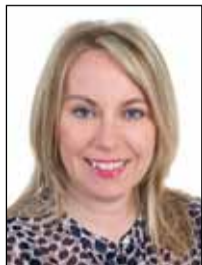
Sigríður Á. Andersen.

Höfundur er alþingismaður Sjálfstæðisflokksins í Reykjavíkurborg kjördæmi suður.