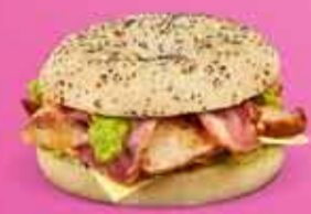
Kjúklingur og beikon