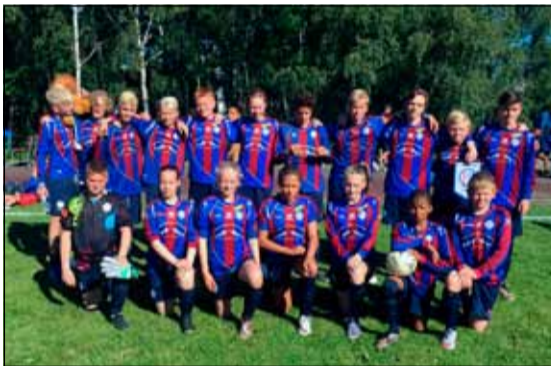
Leiknisstrákar í 14 ára liðinu.