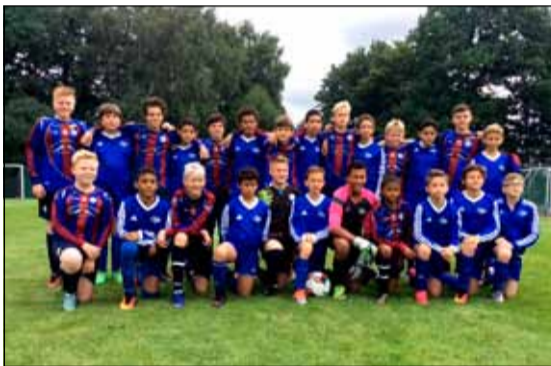
Leiknisstrákar í 13 ára liðinu.

Frábær ferð hjá Leikniskrökkum og hópurinn allur til fyrirmyndar bæði fyrir félagið og hverfið sitt.