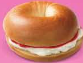
Sulta og rjómaostur