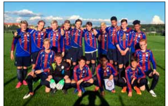
Leiknisstrákar í 15 ára liðinu.