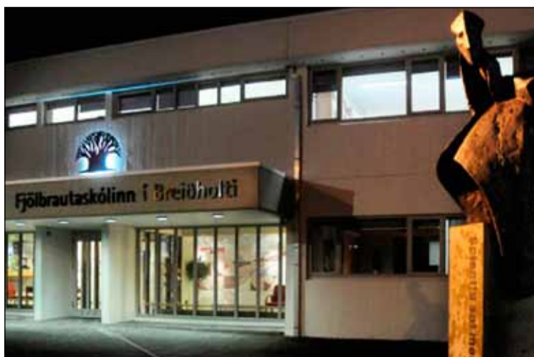
Mikið fjölbreytni er í boði í FB.

Hún segir mikla aðsókn í rafvirkjun, húsasmíði og sjúkraliðanám. „Við bjóðum einnig upp á nám í bóklegum greinum eins og íslensku, stærðfræði, ensku, dönsku og ýmsum félagsgreinum og raungreinum. Á þessari önn bjóðum við í fyrsta sinn upp á nýsköpunaráfanga sem heitir Fab Lab og hvetjum við fólk til að kynna sér hann.“ Staðbundin innritun í Kvöldskóla FB verður fimmtudaginn 18. ágúst frá klukkan 17:00 til klukkan 19:00 í miðrými skólans á 2. hæð. Á staðnum verða umsjónarmenn, námsráðgjafar, fagstjórar og áfangastjórnari. „Við bjóðum fólk