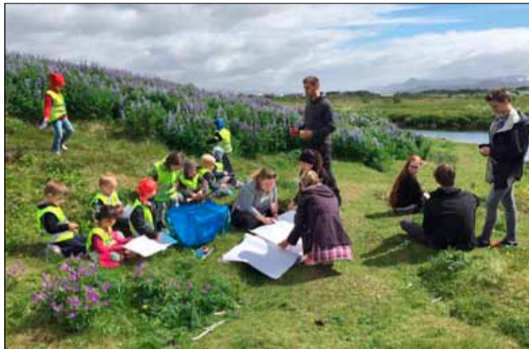
Vinnuskólahópur að störfum á leikskólanum Ösp.

Tveir Vinnuskólahópar voru starfræktir á vegum félagsmiðstöðvanna í sumar. Einn hópurinn var blandaður unglungum úr Bakkanum og Hólmaseli og hinn var með unglunga úr Hundradogellefu og Hólmaseli. Allir unglungarnir í hópnum voru að klára 9. bekk. Markmiðið með hópnum er að kynna unglungunum fyrir mismunandi félagsstörfum, fara í starfskynningar, heimsækja fyrirtæki, taka til í hverfinu og eflast félagslega ásamt því að hafa gaman. Það sem hóparnir tóku sér meðal annars fyrir hendur var að vinna á leikskóla einu sinni í viku, aðstoða við félagsstarf aldraðra, taka rösklega til í hverfinu okkar, gera fínt í kringum félagsmiðstöðvarnar og fá mismunandi fræðslur svo eitthvað sé nefnt. Voru bæði