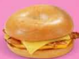
Beikon, egg og ostur