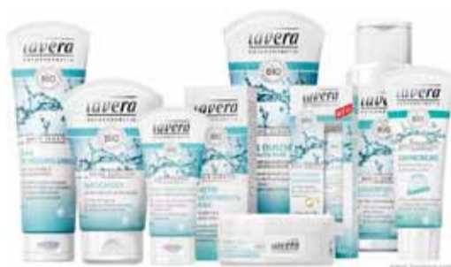
Lavera Vegan og lífrænt vottaðar húðvörur 20% afsláttur