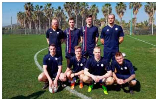
Nokkrir Leiknismenn Meistaraflokkur kátir eftir æfingu.

Fyrsti leikur Leiknis í Inkasso-deildinni er gegn Keflavík á Leiknisvelli 5. maí nk. Við hvetjum alla til að koma og styðja drengina okkar sem án efa verða sólbrúnir og í top-pformi. Áfram Leiknir – Stolt Breiðholts!