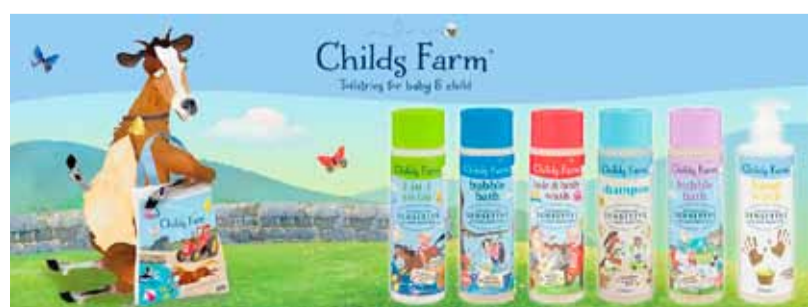
Childs farm barnavörur 20% afsláttur