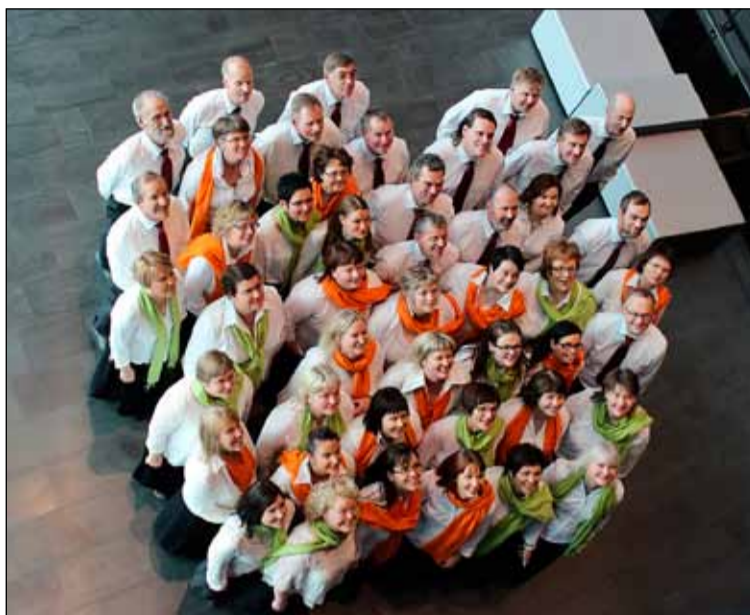
Kór Fella- og Hólakirkju.

Hvað ætla kórarnir að flytja á þessum vortónleikum. „Við ætlum að flytja glæsilega dagskrá. Við munum flytja kórkafla úr Óperunni Ragnheiði eftir Gunnar Þórðarson, kórkafla úr Glóriu Vivaldis og annan úr