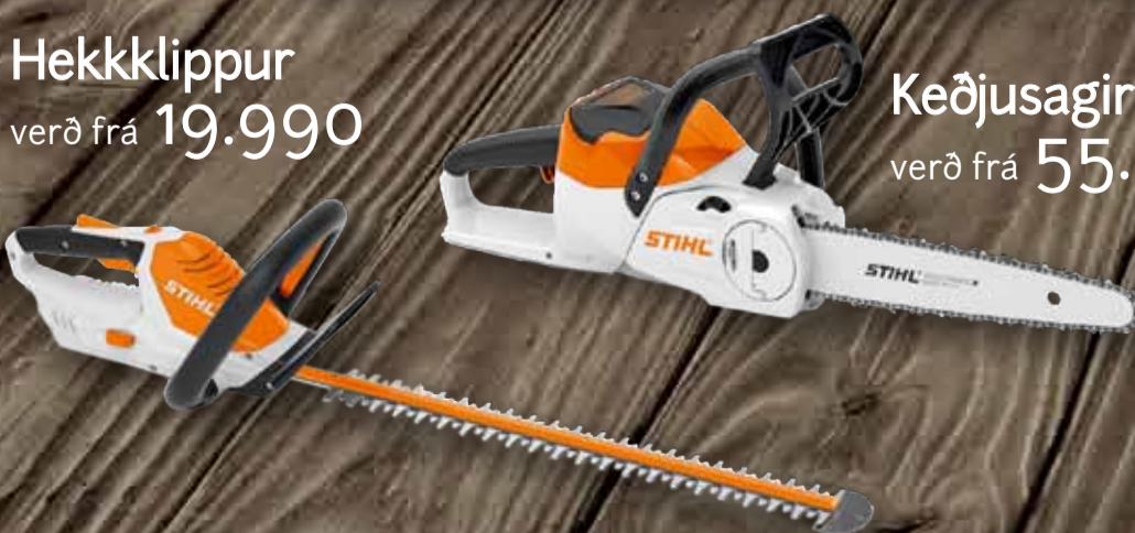
Keðjusagir verð frá 55.950