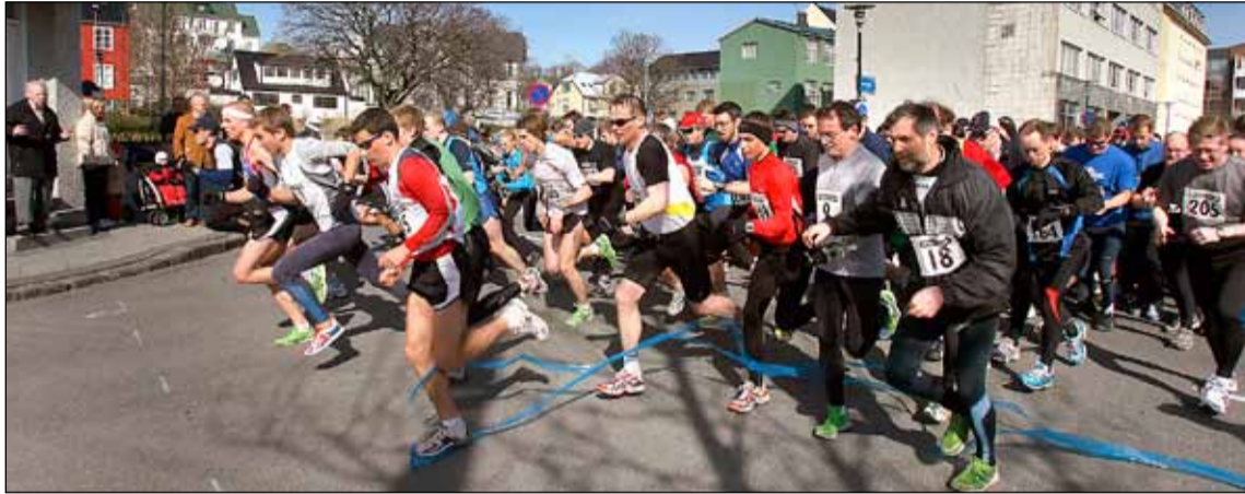
Frá víðavangshlaupi ÍR á síðasta ári.

Víðavangshlaup ÍR það 102. í röðinni fer fram venju samkvæmt á sumardaginn fyrsta þann 20. apríl og er bæði boðið upp á hina hefðbundnu 5 km hlaupaleið en einnig er hægt að taka þátt í 2,7 km skemmtiskokki sem er hugsað sem skemmtilegt fjölskylduhlaup. Samhliða hinum aldarlanga viðburði fer Grunnskólahlaup ÍR fram í annað sinn en það er 2,7 km langt.