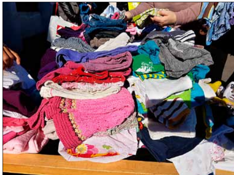
Í Gerðubergi verður lager af barnafötum sem fólk getur fengið í skiptum fyrir önnur föt.