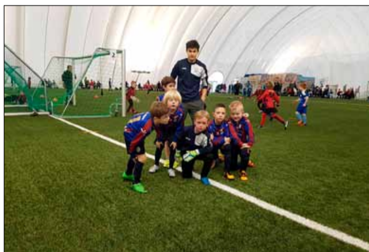
Kátir strákar úr 7. flokki Leiknis með Edda aðstoðarþjálfara.

Við látum eina mynd fylgja hér með en fleiri liðsmyndir má sjá á heimasíðu Leiknis.