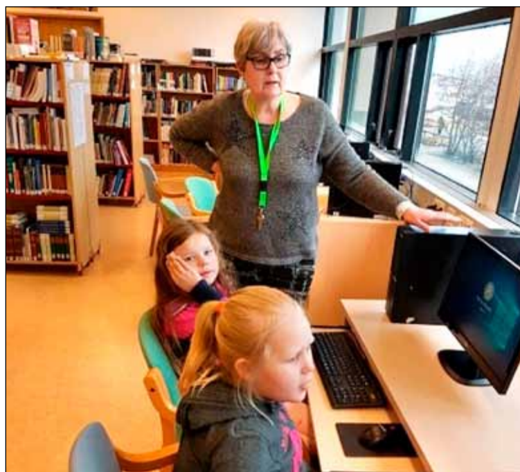
Frá þemadögum í Breiðholtsskóla.

Nemendur unnu m.a. verkefni tengd Elliðaárdal, náttúruhamförum, lífríki og umhverfisvernd. Á miðstiginu vann hver árgangur að ákveðnum verkefnum um Ísland, Norðurlönd og Evrópu. Á yngsta stiginu voru unnin fjölbreytt verkefni meðal annars um mannlíkamann, mannlegar tilfinningar, landnám Íslands og Star wars.