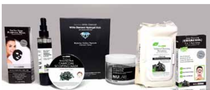
BioMiracle húðvörur 20% afsláttur