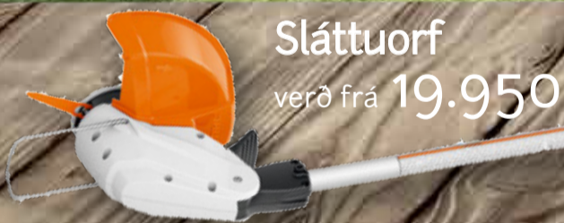
Sláttuorfi verð frá 19.950

Ný lína af batterístækjum frá STIHL þýskt gæðamerki með áralanga reynslu atvinnumanna. Nú á verði fyrir alla garðeigendur.