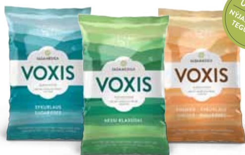
Sykurlaus Voxis, klassískur og sykurlaus með engifer