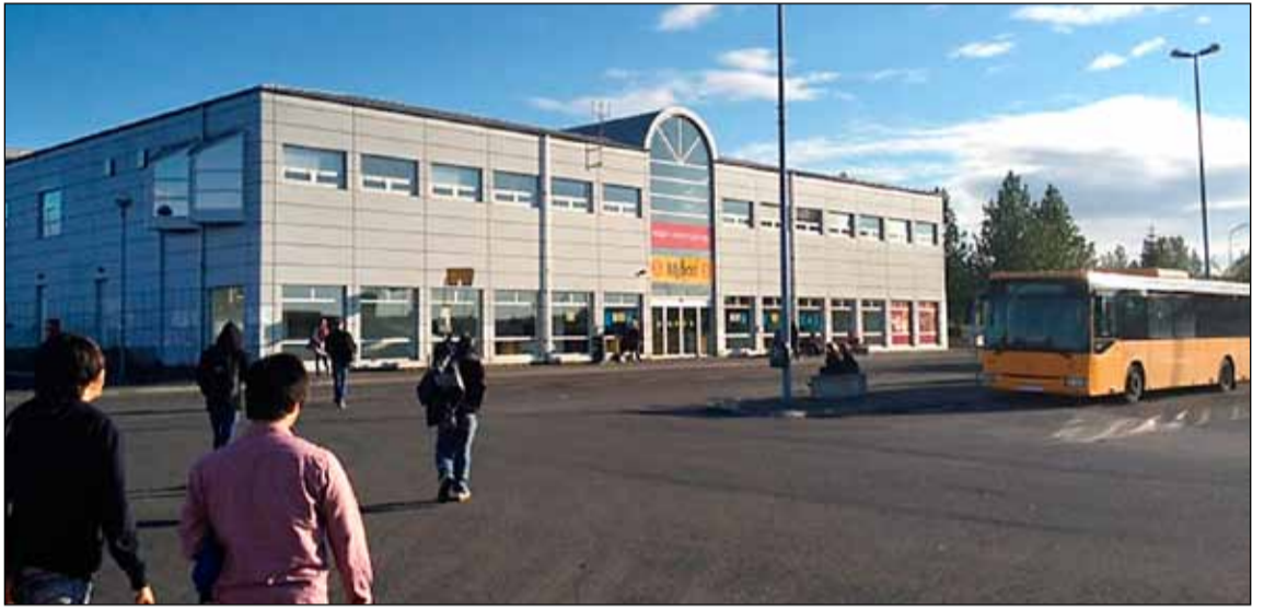
Höfuðstöðvar Strætó í Mjóddinni í Breiðholti.

Ein af aðalstöðvum fyrirhugaðrar borgarlínu á höfuðborgarsvæðinu er í Mjóddinni í Breiðholti. Aðrar stórar samgöngustöðvar verða við Kringluna, Smáralind, Hörpu og BSÍ. Hugmyndin um borgarlínu byggist á svæðisskipulagi höfuðborgarsvæðisins sem var samþykkt 2015. Borgarlínan er nýtt hágaða almenningssamgöngukerfi sem nú er unnið að undirbúning að á vegum Samtaka sveitarfélaga á höfuðborgarsvæðinu.