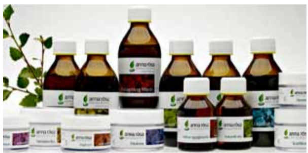
Anna Rósa grasalæknir 25% afsláttur

Í tilefni af nýrri og bjartari verslun bjóðum við viðskiptavinum okkar upp á ýmis tilboð í apríl.