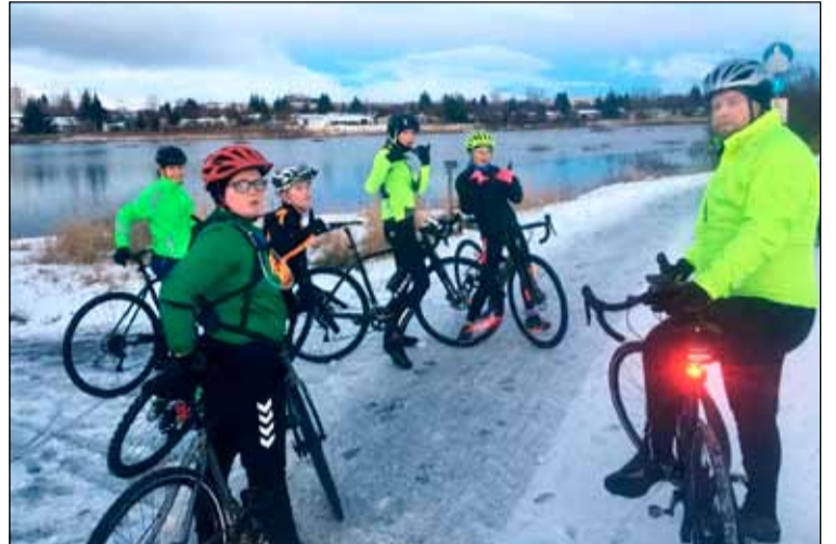
Það er hjólað vetur sem sumar oftast tvisvar í viku og kapparnir láta smá snjó ekki stöðva sig.