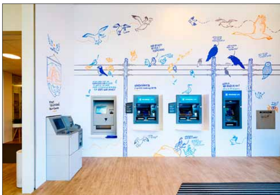
Hraðbankar í nútíma bankastarfsemi setur sinn svip á Arionbanka á Smáratorgi.