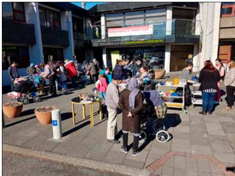
Fjöldi fólks leit við á flötinni fyrir fram Gerðuberg, fékk sér góðgerðir og athugaði hvað var á boðstólum. Sumir komu með föt. Aðrir fengu föt eða fólk skiptist á fötum.