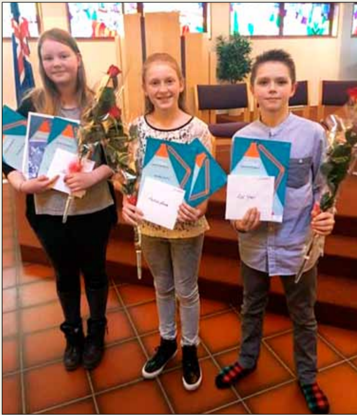
Stoltir sigurvegarar í Stóru upplestrarkeppninni í Breiðholti.

Milli atriða sungu nemendur úr Breiðholti og spiluðu á hljóðfæri.