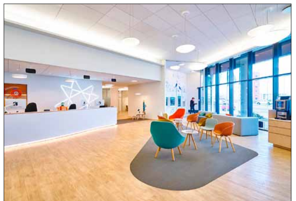
Falleg setustofa í móttökunni í Arionbanka á Smáratorgi.