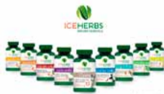
IceHerbs fjallagrös og háls- og hóstamixtúrur 25% afsláttur