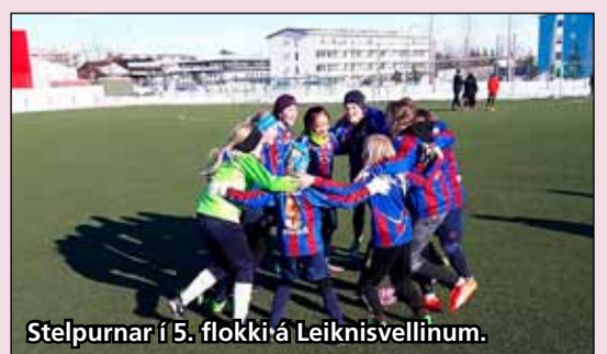
Stelpurnar í 5. flokki á Leiknisvellinum.