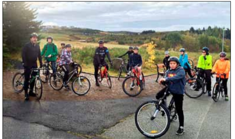
Hluti af hjólalífinu er að njóta útiveru og náttúrunnar.

borgarhluta í Reykjavík, samstarf við Hagaskóla, við erum í Gufunesbæ í Grafarvogi, Norðlingaskóla og nú erum við að hefja starfsemi í mínum gamla heimabæ Breiðholtinu. Það er líka á döfnni að efna til hjóladags í Vesturbænum innan tíðar.“