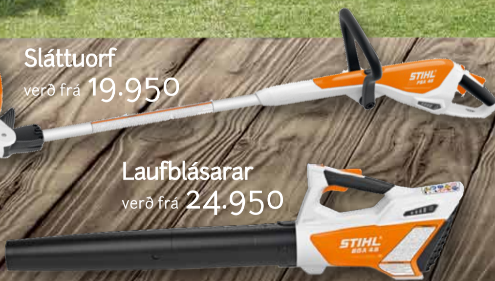
Laufblásarar verð frá 24.950