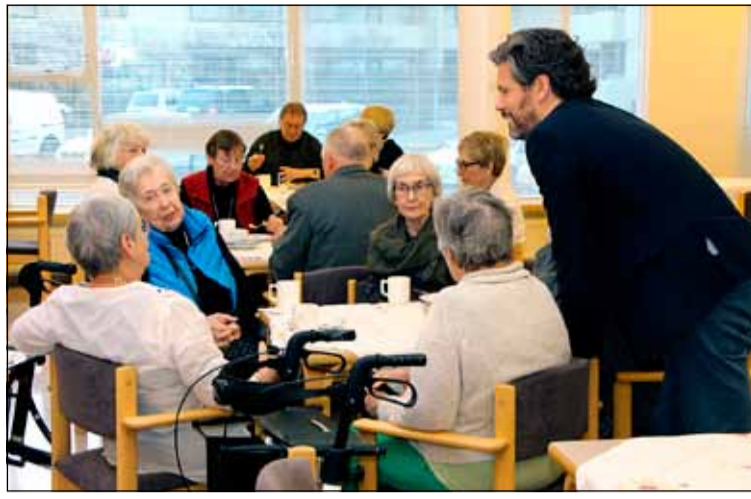
Dagur B. Eggertsson með heldri borgurum í félagsstarfinu á Aflagranda.

- Þið viljið fjölga leikskólalássum og voruð að koma á fót ungbarnadeildum í borginni. Hvernig heldurðu að það muni ganga? „Já, ég vonast til þess að þetta gangi vel. Þarna erum við að brúa bilið enn frekar milli fæðingarorlofs og leikskóla þannig að við reynum sífellt að stytta þann óvissutíma sem tekur við frá því að fæðingarorlofi sleppir, þar til barnið fer inn á leikskóla. Nú strax í haust ætlum við að opna fjórar ungbarnadeildir en endanlegt markmið er að öll börn komist inn á leikskóla um leið og fæðingarorlofi lýkur. Það þarf að taka þetta í skrefum en við munum fylgja þessu vel eftir í haust og meta árangurinn út frá því.“