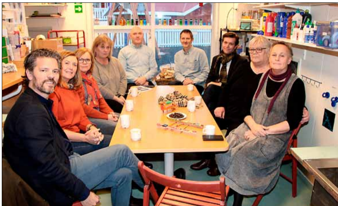
Dagur B. Eggertsson borgarstjóri á fundi með leikskólastjórnendum í Vesturbænum.

Dagur segir mikilvægt að hafa yfirsýn og um leið veita öðrum yfirsýn. „Árin 2015 og 2016 voru metár í uppbyggingu í borginni