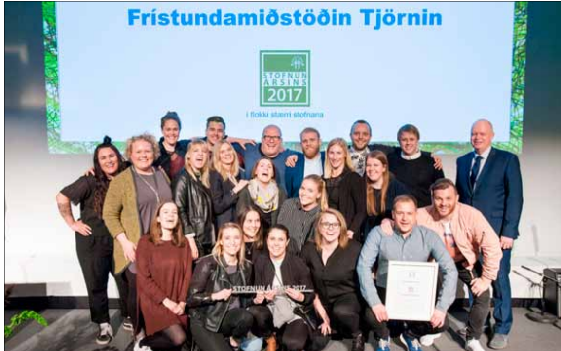
Frístundamiðstöðin Tjörnin var valin stofnun ársins 2017. Á myndinni má sjá starfsfólk frístundamiðstöðvarinnar eftir að hafa tekið við viðurkenningunni. Sjá nánar á bls. 10.