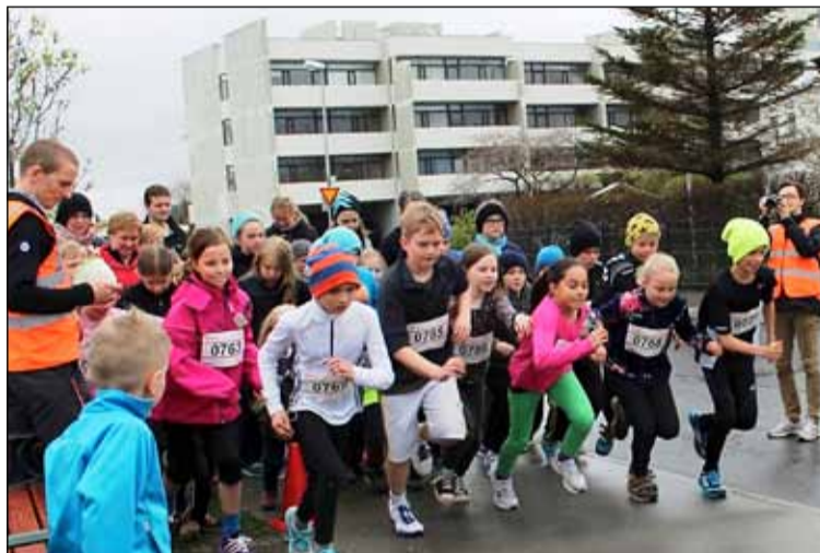
Vaskir krakkar á vegum KR frjálsra spretta úr spori.

Vegna mikillar fjölgunar iðkenda hefur orðið að bæta við þjálfurum og reynsla undanfarinna ára nýtt til að hámarka not af þeirri aðstöðu sem í boði er á athafnasvæði KR við Frostaskjólíð. Einnig hafa æfingar farið fram í frjálsíþróttahöllinni í Laugardal. Nú er hins vegar svo komið að vart verður lengra gengið