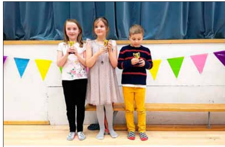
Verðlaunahafar í hæfileikakeppninni.