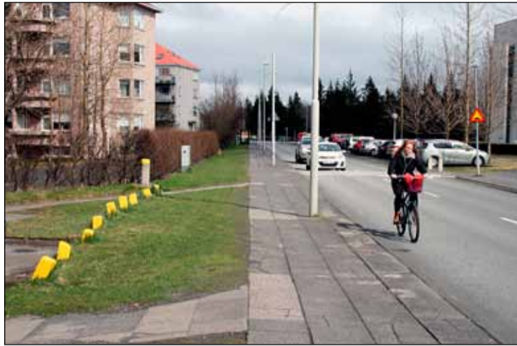
Talsverð umferð ökutækja sem gangandi vegfarenda er við Birkimel sem tengir m.a. annars Hringbraut við Hagatorg.

Á liðnu ári kom fram hugmynd frá íbúa um að endurnýja gangstétt og gera hjólastíg við Birkimel í íbúalýðræðisverkefninu Hverfið mitt. Hugmyndin var síðan kosin til framkvæmda í íbúakosningum. Verja átt tíu milljónum til verkefnisins. Umhverfis- og skipulagsráð ákvað að bæta um betur og ráðast í endurnýjun á lýsingu við götuna og leggja breiða göngu- og