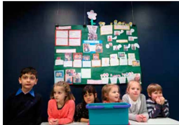
Krakkahópurinn sem kynnti verkefnið.