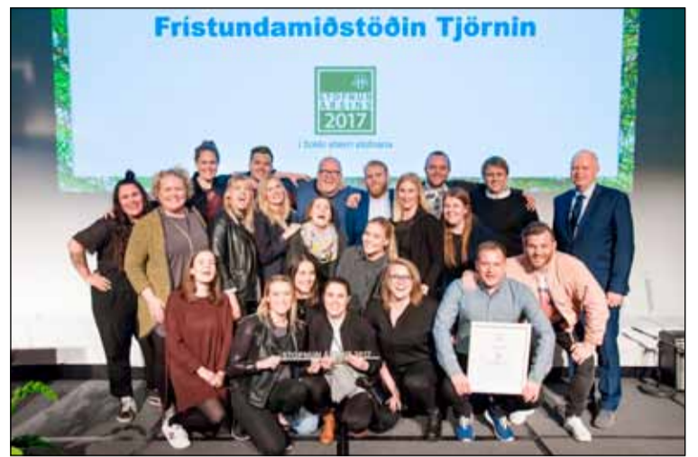
Starfsfólk Tjarnarinnar – stofnunar ársins 2017.

Könnun sem þessi gefur góða mynd af starfsumhverfi og starfsánægju starfsmanna stofnunar. Starfsmenn geta notað niðurstöðurnar til að meta eigin vinnustað í samanburði við aðrar stofnanir. Einnig eru niðurstöðurnar ekki síður tækifæri fyrir stjórnendur að gera sér grein fyrir stöðu starfsmannamála í stofnuninni og hvar þeir standa í samanburði við aðra. Í könnun St.Rv. er leitað