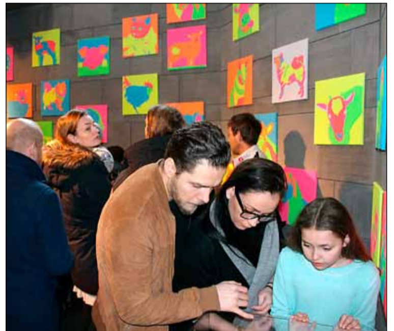
Foreldrar og aðrir aðstandendur skoðuðu verk barnanna á opnuninni.