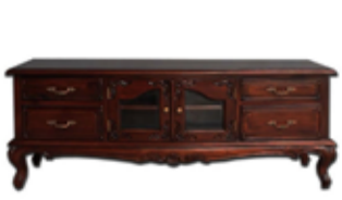
98.000 Sjónvarpsskápur 135 x 45 sm - h. 55 sm

Skoðið úrvalið í vefverslun okkar - www.husgagnabankinn.is