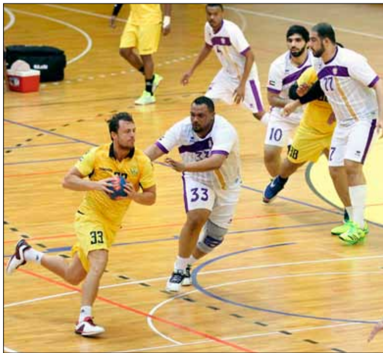
Á fullri ferð á vellinum. Spurning hvort Dubai strákarnir hafi verið bænheyrðir að þessu sinni.