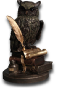
13.000 Stytta Wise ugle 15 x 14 sm h. 23 sm