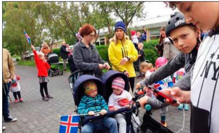
Reiðhjól og tvíburakerrur voru á meðal farartækja.