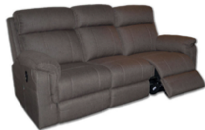
175.000 Rafknúinn hægindasófi Klæddur í sterkt áklæði