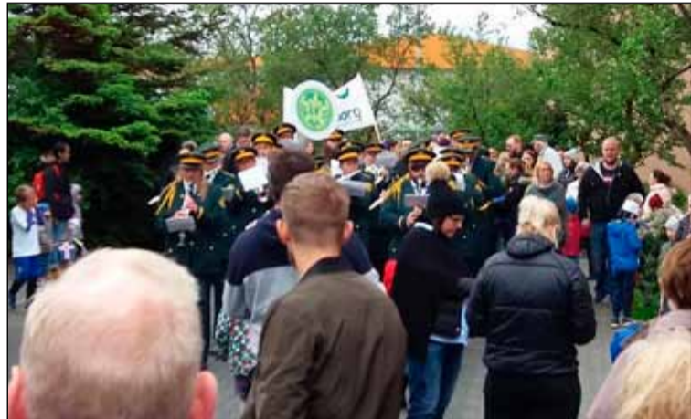
Lagt af stað í skrúðgönguna undir lúðrablastri.

og kennarar. Stoppaði hópurinn fyrir utan Seljahlíð og sungið og spilað var fyrir íbúana. Eftir það var gengið í kringum tjörnina og sungin fleiri lög. Að þessu loknu héldu allir í sína leikskóla, þar sem grillaðar voru pylsur, og ýmislegt gert sér til skemmtunar.