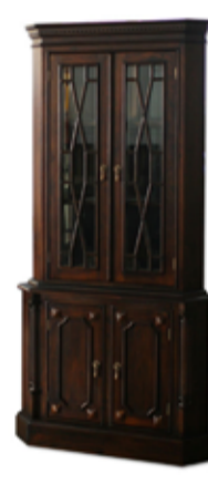
104.000 Hornskápur 100 x 55 sm - h. 190 sm