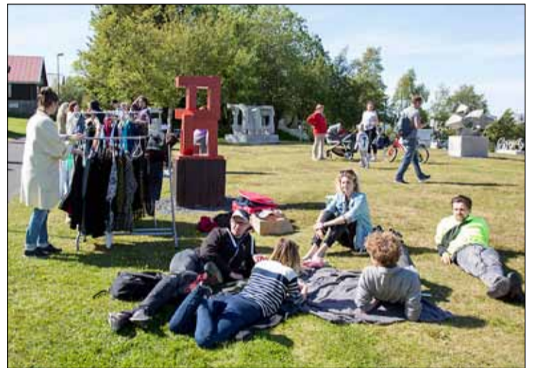
Fatamarkaðir og fleira í Hallsteinsgarði við Vogasel en garðurinn hefur verið miðpunktur Breiðholt Festival frá byrjun.

Matarmarkaður var á svæðinu var þar sem tyrkneskur og nepalskur matur var á boðstólum meðal annars góðgættis úr Seljahverfinu. Nepalski maturinn er vinsæll og allt seldist upp