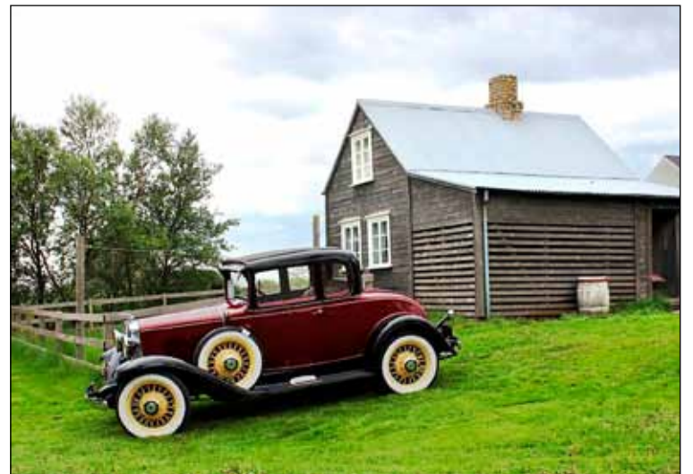
Á meðal sýningargripa var þessi aldargamli bílfákur sem vissulega er sjaldséður á götum borgarinnar.