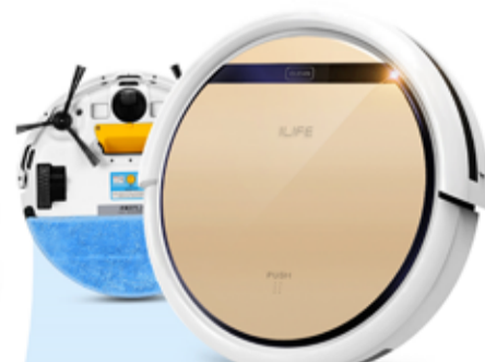
36.000 ILIFE V5PRO, ryksuguvélmenni Blautmoppun, fjarstýring, fallvörn og heimastöð