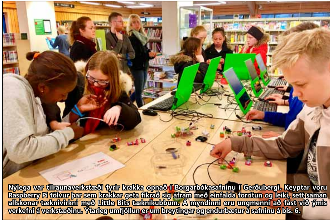
Nýlega var tilraunaverkstæði fyrir krakka opnað í Borgarbókasafninu í Gerðubergi. Keyptar voru Raspberry Pi tölvur þar sem krakkar geta fíkrað sig áfram með einfalda forritun og leiki, sett saman allskonar tæknivirkni með Little Bits tæknikubbum. Á myndinni eru ungmenni að fást við ýmis verkefni á verkstæðinu. Ýtarleg umfjöllun er um breytingar og endurbætur á safninu á bls. 6.

Opið allan sólarhringinn í Engihjalla, Vesturbergi og Arnarbakka