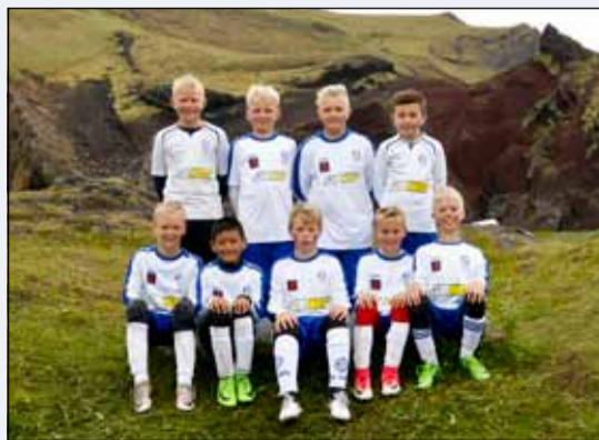
Hluti af ÍR-ingum sem tóku þátt í Orkumótinu.

Fjölmennur hópur stráka á yngra ári í 6. flokki karla hélt til Selfoss á Set-mótið sem fram fór í byrjun júní. 6 lið héldu merki ÍR á lofti með flottri spilamennsku og góðum leik. Að lokum þá héldu eldri árs strákar í 6. flokknum til Vestmannaeyja á Orkumótið, stórmótið mikla. 4 lið frá ÍR tóku þátt og upplifðu hið mikla ævintýri sem þetta 30 ára mót er, og auk skemmtilegra stunda á fótboltavellinum lögðu sitt af mörkum við bíómyndina Víti í Vestmannaeyjum, en upptökur á þeirri mynd fóru einmitt fram á sama tíma, öllum til mikillar gleði. Einn besti árangur ÍR í mörg ár og jafnvel áratugi varð ljós þegar að eitt lið ÍR