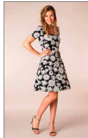
Sýnishorn af fatnaði sem Belladonna er með til sölu.