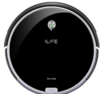
46.000 ILIFE A6, ryksuguvélmenni Ósýnilegur veggur, fjarstýring, fallvörn og heimastöð

www.husgagnabankinn.is - Faxafen 10, 108 Reykjavík - s. 511 0030