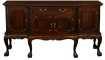
147.000 Chippendale skenkur 180 x 64 sm - h. 100 sm