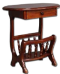
34.000 Blaðgrindarborð 58 x 40 sm - h. 65 sm