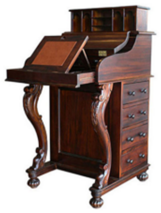
89.000 Davenport skrifpúlt 55 x 65 sm - h. 95 sm