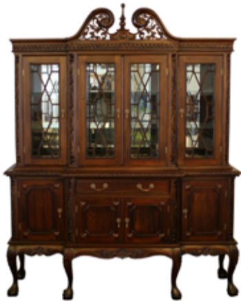
285.000 Chippendale skápur 180 x 55 sm - h. 225 sm