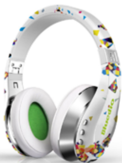
12.500 Bluedio Air þráðlaus heyrnatól Frábær hljómgæði