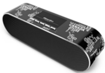
12.000 Bluedio Air AS (Air) þráðlaus Wi-Fi Bluetooth hátalari