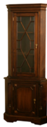
94.000 Hornskápur 76 x 55 sm - h. 190 sm