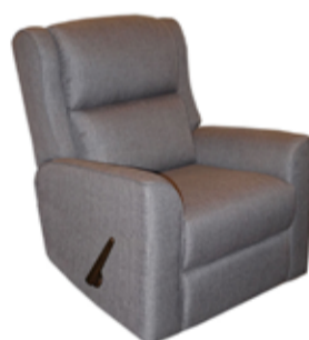
59.000 Hægindastóll Klæddur í sterkt áklæði