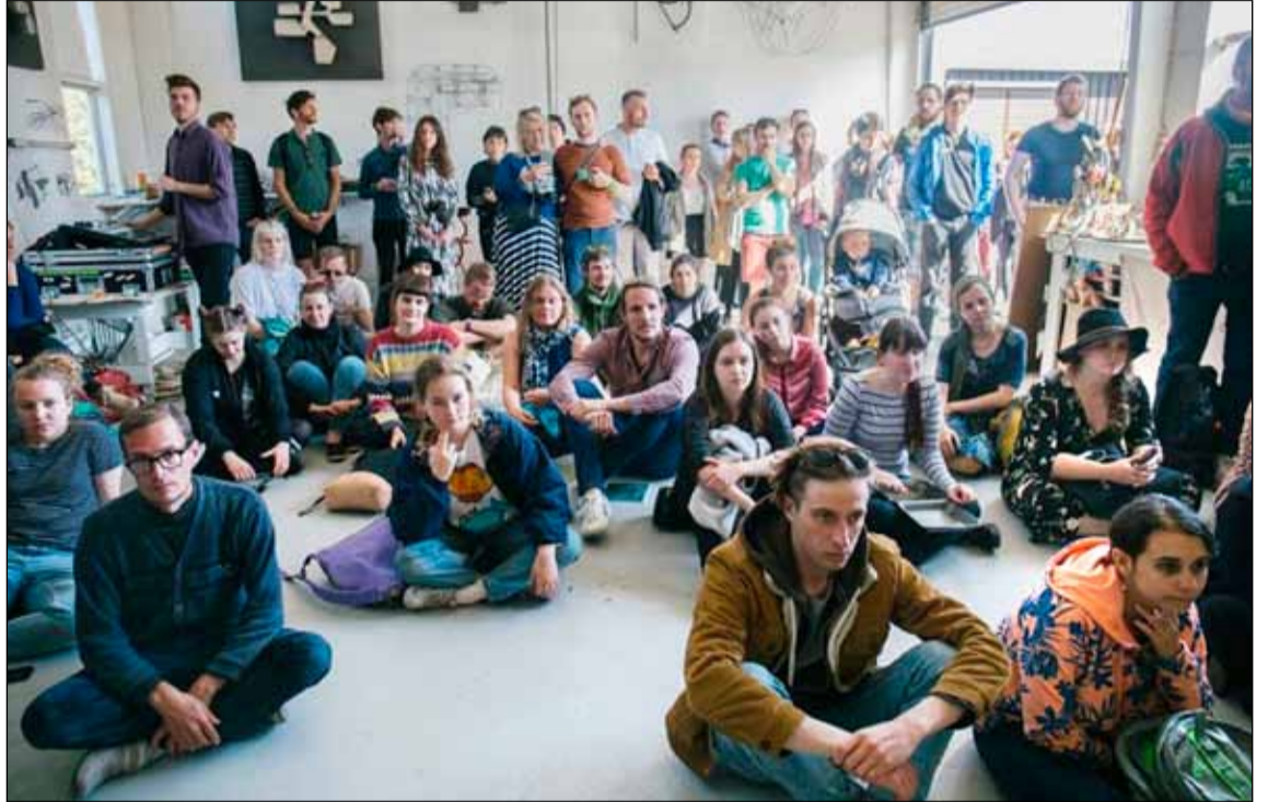
Tónlistaratriði fóru m.a. fram í hljóðveri í Vogaseli.

Listahátíðin Breiðholts Festival var haldin í þriðja sinn í Seljahverfinu og nágrenni í júní. Hátíðin var vel sótt og góð stemning á hátíðasvæðinu úti og inni. Hátíðin var fyrst haldin sumarið 2015 en á bak við hana eru aðstandendur hljóðversins Gróðurhúsið í Vogaseli sem í ár á 20 ára afmæli. Tilurð hátíðarinnar er að vekja athygli á þeirri list sem á sér stað í Breiðholtinu og kynna það fyrir íbúum hverfisins.