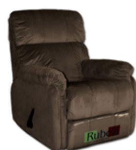
59.000 Hægindastóll Snúningur og rugga Klæddur í sterkt áklæði