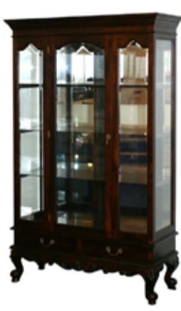
159.000 Glerskápur 120 x 45 sm - h. 195 sm