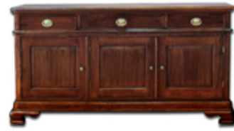
137.000 Vanessa skenkur 175 x 50 sm - h. 92 sm