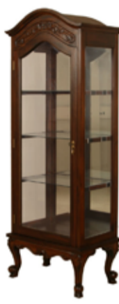
104.000 Glerskápur 70 x 40 sm - h. 190 sm