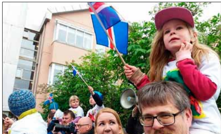
Ekki verja að vera á háhesti hjá pabba.