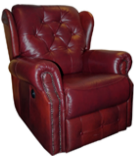
169.000 Rafknúinn hægindastóll Alklæddur í ekta leður