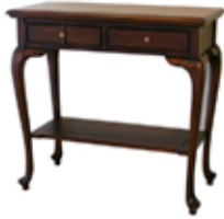
59.000 Hliðarborð 90 x 40 sm - h. 86 sm