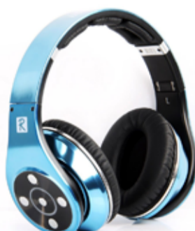
15.500 Bluedio R+ Legend þráðlaus heyrnatól SD kortaspilari