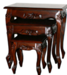
48.000 Viktorian innskotsborð 60 x 45 sm - h. 60 sm