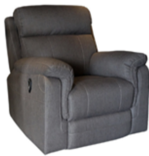
89.000 Rafknúinn hægindastóll Klæddur í sterkt áklæði