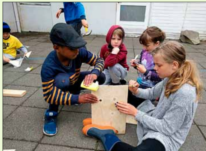
Börn í leik og starfi í sumar.