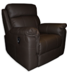
149.000 Rafknúinn hægindastóll Alklæddur í ekta leður