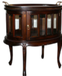
49.000 Teborð með bakka 75 x 50 sm - h. 75 sm