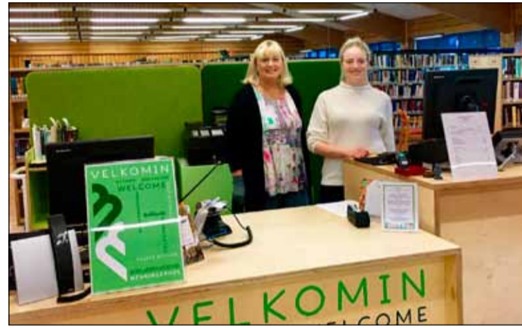
Flestu var breytt nema að gamla góða starfsfólkið er enn til staðar.

semina enn betur í kringum þessa nýja þjónustu. Fullorðnir eru að sýna þessari nýjung mikinn áhuga og auðvitað geta þeir líka komið og fíkað.