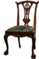
39.000 Chippendale stóll 55 x 45 sm - h. 105 sm