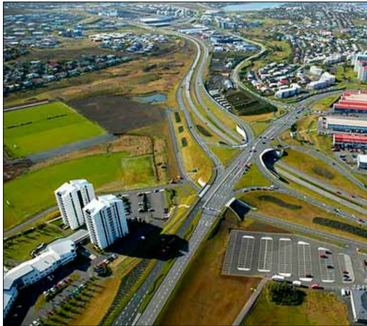
Ákvörðun hefur verið tekin um að heimila byggingu allt að 130 íbúða í Suður-Mjódd í Breiðholti.

Þetta kemur fram í nýrri samþykkt um breytingar á aðalskipulagi Reykjavíkur frá 2010 til 2030 sem var samþykkt í borgarráði. Samkvæmt henni eru heimildir til íbúðabygginga á fjölmörgum byggingarsvæðum í borginni auknar í heild um allt að eitt þúsund íbúðir. Er þar fyrst og fremst um að ræða heimildir til að byggja smærri íbúðir en byggingarmagn ekki aukið að sama skapi. Meginmarkmið og tilgangur breytingartillagna á Aðalskipulagi Reykjavíkur 2010 til 2030 eru að mæta breyttum þörfum á húsnæðismarkaði og tryggja framfylgd Húsnæðisstefnu Reykjavíkurborgar og húsnæðisáætlana borgarinnar til skemrri tíma. Einnig til að skapa aukið svigrúm til uppbyggingar íbúða á völdum reitum, m.a. til að ýta undir byggingu smærri íbúða. Nú er unnið að því að