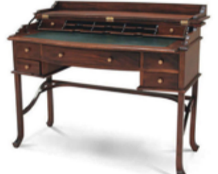
104.000 Campaign skrifpúlt 112 x 65 sm - h. 93 sm