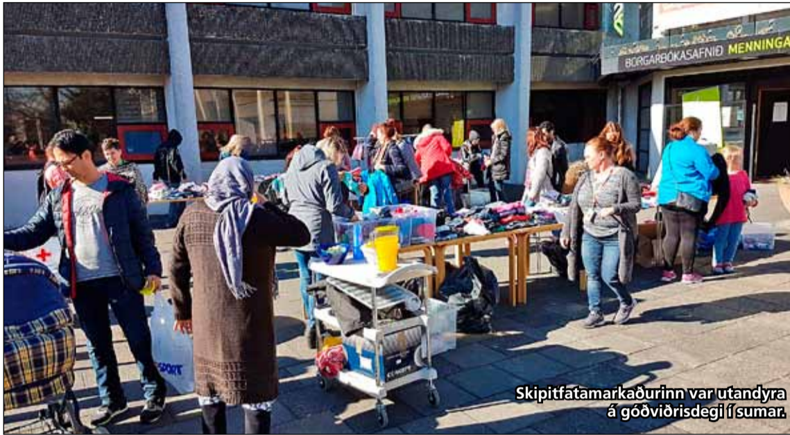
Skiptifatamarkaðurinn var utandyra á góðviðrisdegi í sumar.

Skiptifatamarkaður með barnaföt sem fór af stað í Gerðubergi fyrir á þessu ári hefur farið af stað í Breiðholti er að taka til starfa eftir sumarhlé. Það er Rauði krossinn í Reykjavík sem stendur að baki markaðnum í samstarfi við Fjölskyldumiðstöðina í Breiðholti. Fyrsti markaðsdagurinn var í Gerðubergi föstudaginn 31. mars sl. en næsti markaðsdagur verður í Gerðubergi laugardaginn 2. september og verður markaðsdagur síðasta laugardag í mánuði til loka nóvember til að byrja með. Raunar verða tveir markaðsdagar í september vegna þess að ekki verður markaðsdagur síðasta laugardag í ágúst.