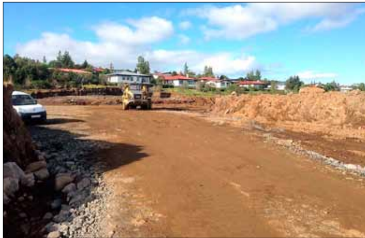
Framkvæmdir við íþróttamannvirki ÍR í fullum gangi.

Nú er verið að ýta farginu ofan af svæðinu og hluti jarðvegsins nýttur í manir umhverfis frjálsíþróttavöllinn og í æfingarsvæði vestan núverandi knattspyrnavalla. Síðan verður sett 80 cm fyllingarefni yfir allt frjálsíþróttavallahúsveðið og skipt um jarðveg fyrir vallahúsinu. Undirbyggingu vallahúsins á að vera lokið 15. október n.k. Vorið 2018 verður svo malbikað undir hlaupabrautirnar og gerviefni lagt á völinn. Á sama tíma á vallahúsið að vera tilbúið. Reykjavíkurborg kostar framkvæmdirnar.