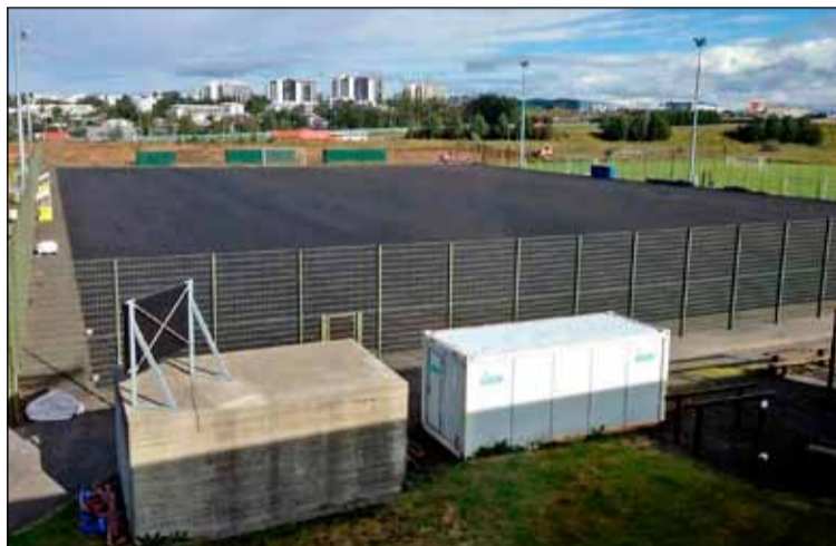
Frjálsíþróttavöllur ÍR undirbyggður.

Innan skamms hefjast aðgerðir til að bæta umgjörð aðalleikvangs