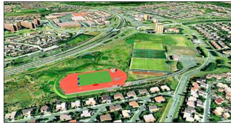
Séð yfir ÍR svæðið í Suður Mjódd. Á teikningunni hefur íþróttavöllur fyrir ÍR verið settur inn.

athugasemdir vegna vilyrðisins til Heklu þar sem talið var að svo umfangsmikið athafnasvæði myndi ekki rúmast vel á þessu svæði. Flutningur Heklu í Mjóddina er hluti af stærra máli en það er uppbygging íbúðarhúsnæðis á Heklureitnum við Laugaveg þar sem bíla- og vélaumboðið hefur verið í langan tíma. Að deiliskipulaginu frágengnu og samþykkti má gera