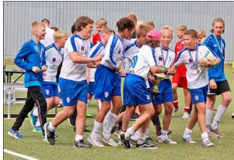
Lið ÍR 2 í 4. flokki karla C liða fagnar sigri á Rey Cup.

Nokkur lið frá ÍR tóku þátt í Rey Cup alþjóðlegu knattspyrnumóti í laugardalnum 26. - 30. júlí og náðu frábærum árangri. Mótið er fyrir 13-16 ára og er þetta langstærsta knattspyrnumót landsins, fyrir þennan aldur, þar sem um 1.500 unglingar koma saman, spila fótbolta og skemmta sér.