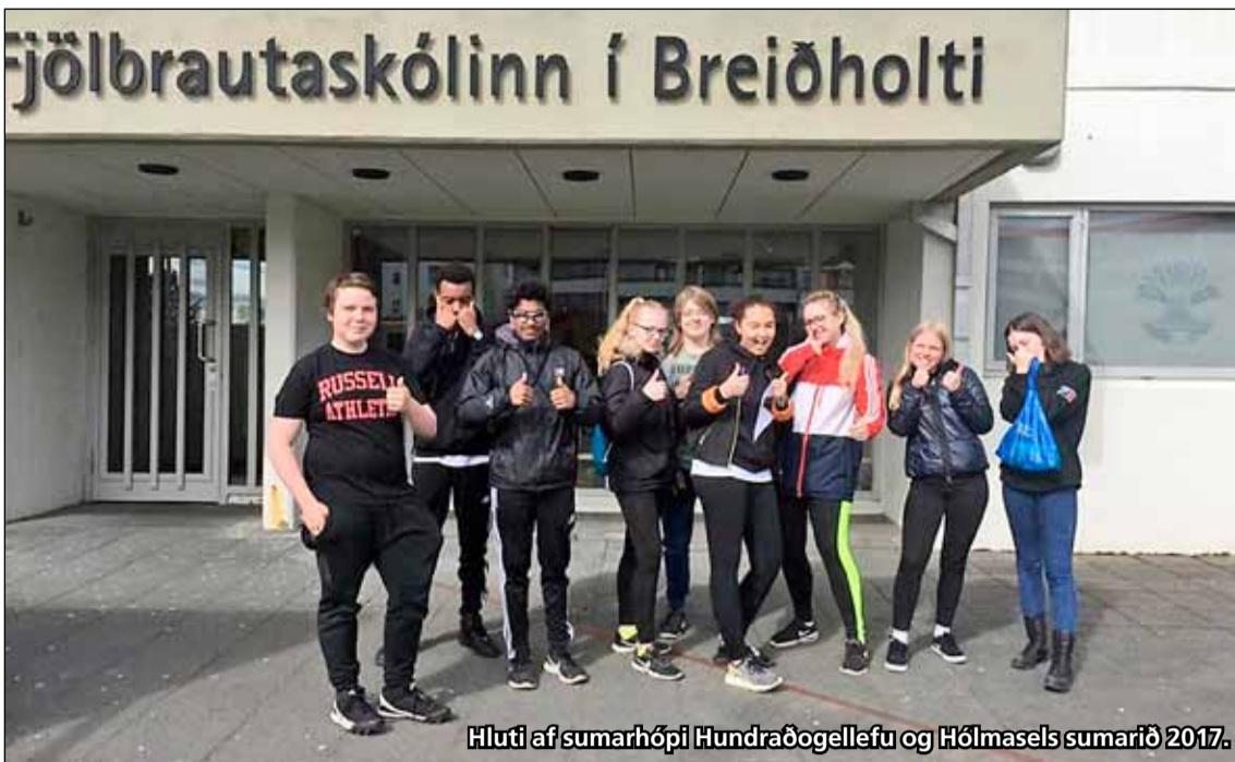
Hluti af sumarhópi Hundraðogellefu og Hólmasels sumarið 2017.