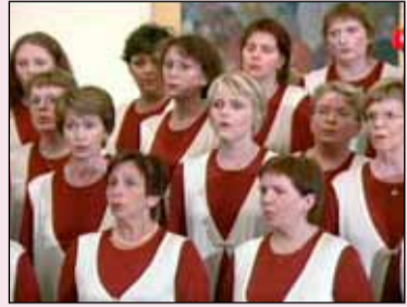
Kórfélagar úr Seljunum taka lagið á góðri stundu.

Glæsilegir bingóvinningar verða í boði og því eftirsóknarvert að mæta, taka þátt í kapphlaupinu um vinningana og fá sér gott með kaffinu. Ágóði af bingóinu rennur nú sem fyrr til góðgerðamála en Seljurnar hafa á undanförunum árum styrkt ýmsa aðila í Breiðholti.