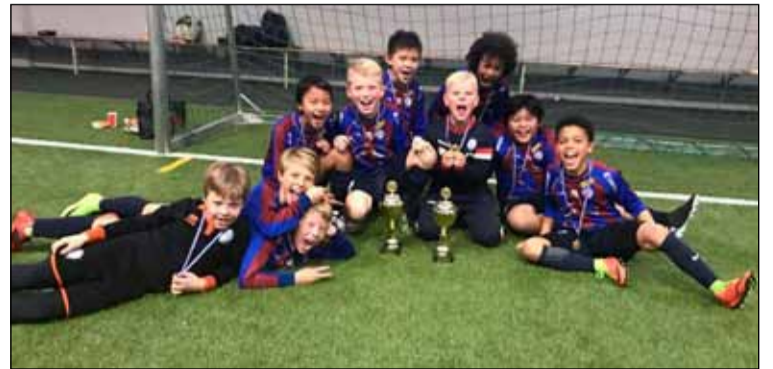
Hressir Leiknisstrákar í sjötta flokki.

Leiknismenn sendu fimm lið á mótið í íslensku, frönsku, þýsku og spænsku deildinni. Leiknismenn stóðu sig með mikilli þryði á móttinu og gerðu sér lítið fyrir og unnu íslensku og frönsku deildina. Þar fyrir utan lentu Leiknismenn í einum af fimm efstu sætunum í hinum deildunum. Frábær árangur hjá okkur mönnum sem hafa staðið sig virkilega vel á æfingum það sem af er vetri.