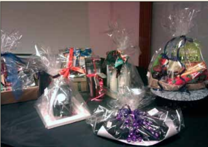
Fallegir vinningar voru á bingóinu.

Það eru alltaf góðir vinningar bæði fyrir börn og fullorðna á bingóinu því þetta er fjölskylduskemmtun og allir geta verið með. Dyngja hefur frá stofnun klúbbsins styrkt ýmsa starfsemi sem vinnur fyrir og með börnum og einnig einstaklinga. Breiðholtið er mannmargt hverfi og mörg börn sem búa þar. Við höfum alltaf haft sérstakan áhuga á að styrkja og aðstoða börn í hverfinu og sjáum, t.d. um að afhenda hjálma í Seljahverfinu. Klúbburinn er fyrir konur og er bæði skemmtilegt og gefandi að vera með okkur. Ýmislegt skemmtilegt er á döfinni í vetur og konur á hvaða aldri sem er geta komið og kynnt sér það sem við erum að gera og vera með okkur í að vinna fyrir öll börn.