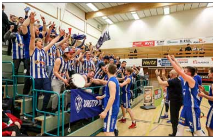
Áhorfendur fagna sigri ÍR á Tindastóli í leik tvö.

Kvennalið ÍR í handbolta tryggði sér rétt til þátttöku í umspili um sæti í efstu deild á næstu leiktíð eftir að hafa náð þriðja sæti í Grill 66 deildinni (næst efstu deild). Lið ÍR tapaði fyrsta leiknum gegn HK í umspili með tíu marka mun en jafnaði