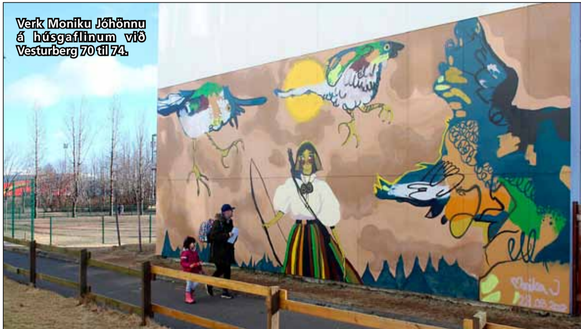
Verk Moniku Jóhannu á húsgaflinum við Vesturberg 70 til 74.

Borgarráð Reykjavíkurborgar veitti FB 200.000 króna styrk til verkefnisins en auk þess styrkir hússjóður Vesturbergs 70 til 74 uppsetninguna sem og FB og Litaland. Myndin nefnist Fuglaflæði og er byggð upp í kringum hugmynd af fuglum á flugi og stúlku með boga og örvar.