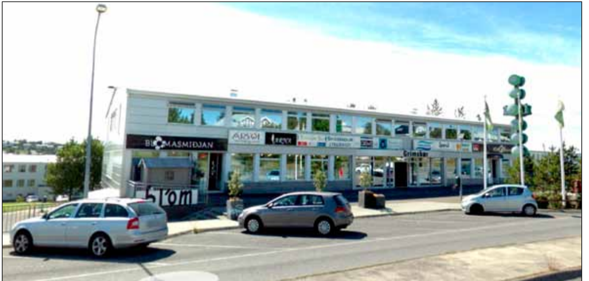
Verslunarmiðstöðin Grímsbær við Bústaðavegin.

Margir Breiðholtsbúar aka Bústaðavegin nánast daglega t. d. í og úr vinnu og skóla. Verslunarmiðstöðin Grímsbær hefur staðið við Bústaðavegin í a.m.k. 40 ár og þar er fjölbætt verslun og þjónusta. Okkur datt í hug að kynna fyrir lesendum hvaða starfsemi væri í húsinu. Auðveld aðkoma er að Grímsbæ og næg bílastæði. Nú svo stoppar leið 11 alveg við dyrnar.