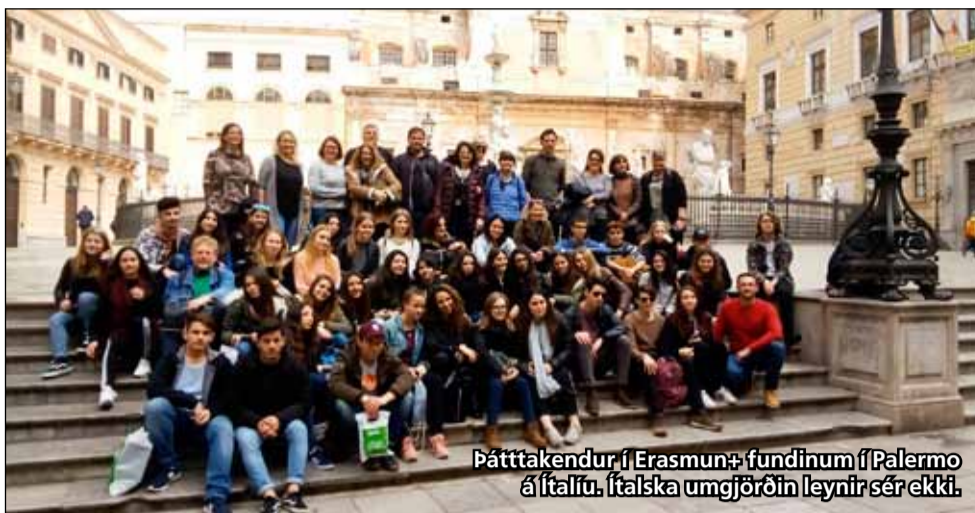
Þátttakendur í Erasmus+ fundinum í Palermo á Ítalíu. Ítalska umgjörðin leynir sér ekki.

Ströng dagskrá flesta daga, verkefnavinna og mikið um heimsóknir á söfn og í kirkjur. Nemendur fóru svo á ströndina flest kvöld, þó að veðrið hafi ekki verið upp á sitt besta. Ströndin er staðurinn sem unglingarnir fara á og þangað mæta allir. Eins og alltaf eru þessar ferðir ótrúleg upplifun fyrir alla þátttakendur, maður kynnist stöðunum út frá sjónarhóli heimafélksins og borðar það sem innfæddir eru stoltastir af að bera fram fyrir gestina. Í þessu verkefni eru sjö þjóðir. Ísland þar sem Hólabrekkuskóli er fyrir Íslands hönd, Finnland, Ítalía, Spánn, Grikkland, Tékkland og Holland. Næsti fundur verður á Íslandi frá 9. til 15. apríl.