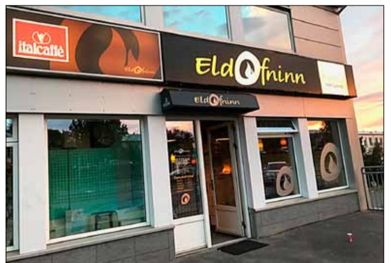
Eldofninn í Grímsbæ.

Í vesturenda hússins er hinn margrómaði pizzastaður Eldofninn fjölskyldurekinn Pizzastaður sem sérhæfir sig í eldbökuðum þunnbotna eðal pizzum þar sem pizza-deig og sósa er löguð á hverjum degi. Eldofninn flytur líka inn og selur kaffi frá Ítalíu, Italcaffe. Gran crema baunir í 1000 gr. pakkningum,