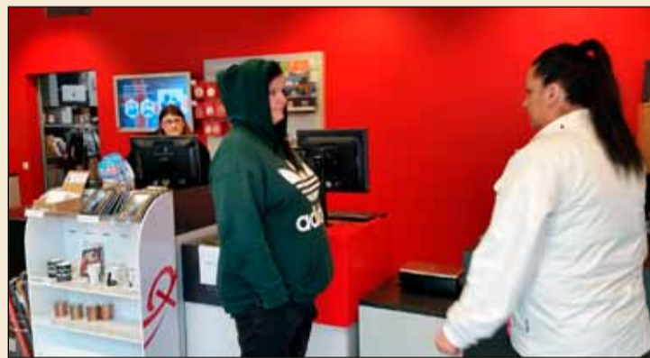
Pósthúsið við Þönglabakka í Mjódd.

Hugmyndir um kaup á húsnæði Íslandspósts kemur í framhaldi af því að nýlega festi borgin kaup á húsnæði sem var í eigu Strætó bs. á annarri hæð hússins. Borgin á því um 21% eignarhluta í húsinu nú þegar en myndi eignast allt að 79% ef af kaupum á húsnæði