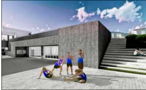
Reisa á nýtt þjónustuhús fyrir ÍR jafnhliða byggingu frjálsíþróttavallar. Hér má sjá tölvugerða mynd af þjónustuhúsinu.

Verktakar hafa lokið við uppsetningu girðinga við aðalleikvang ÍR fyrir knattspyrnu og aðgengi áhorfenda og fatlaðra hefur verið bætt með malbikuðum stíg frá vallarhúsi að áhorfendasvæði. Áður en leiktíð knattspyrnunnar hefst verður aðgengi leikmanna frá búningsklefum að leikvangi bætt.