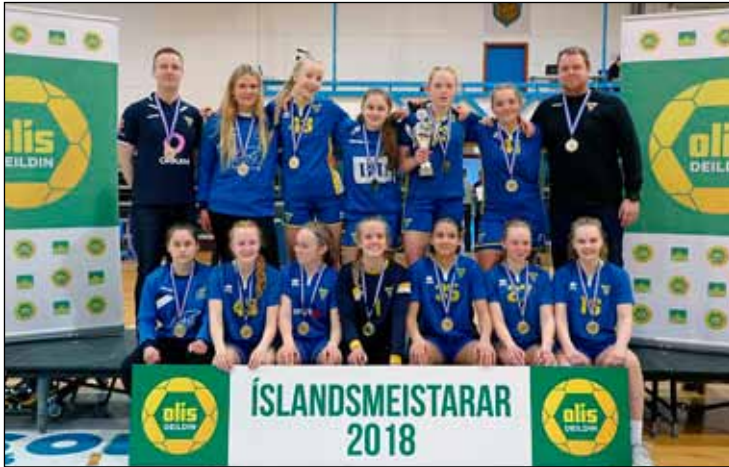
Gróttustelpurnar að loknum leik í Safamýrinni.

Fimmtudaginn 10. maí spilaði 4. flokkur kvenna yngri til úrslita um Íslandsmeistaratiðilinn í handknattleik. Þær öttu kappi gegn sterku liði Hauka og var leikurinn jafn og spennandi.