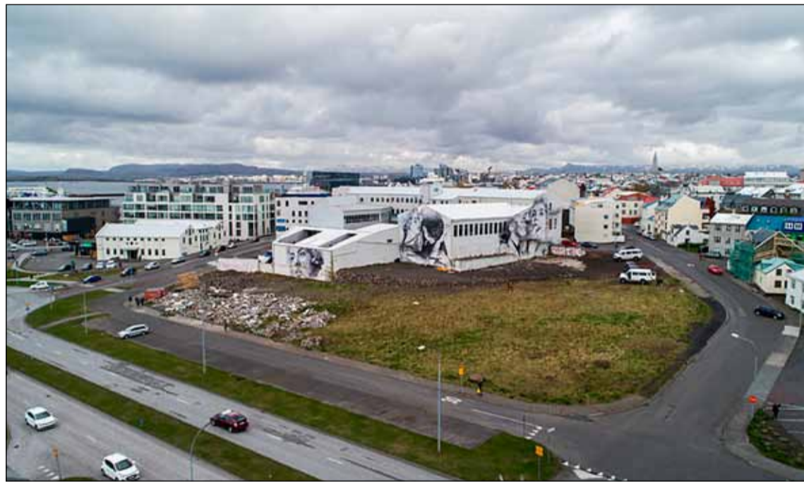
Séð yfir Héðinsreit.

- enn óvíst með BYKO reitinn við Hringbraut