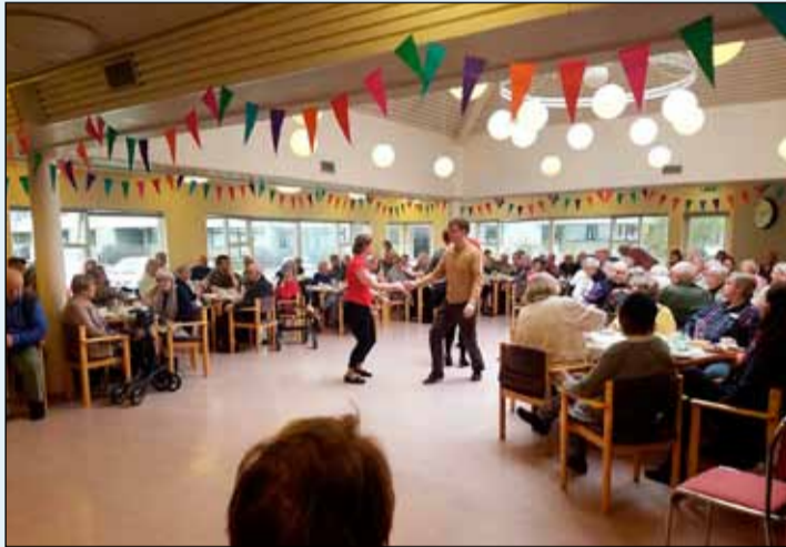
Dansað á Aflagrandanum.

Félagsmiðstöðin að Aflagranda er að bæta við þremur nýjum námskeiðum í haust og hvetjum við ykkur til að skoða þessi námskeið.