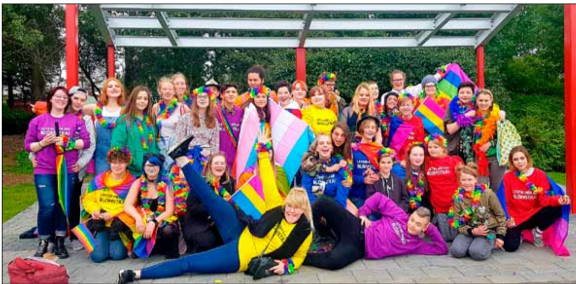
Ánægt fólk eftir þátttöku í gleðigöngunni.

Það voru rúmlega 40 unglingar sem tóku þátt í undirbúningi og framkvæmd á