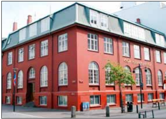
Pósthúsið var byggt á árinum frá 1914 til 1915 eftir teikningu Rögnvaldar Ólafssonar arkitekts.

Ástæður þess að sú starfsemi Íslandspóst sem verið hefur í húsinu verður flutt að þetta húsnæði