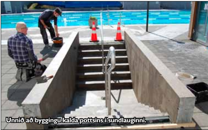
Unnið að byggingu kalda pottisins í sundlauginni.