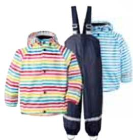
SLASKEMAN POLLAGALLI 8.995 KR.