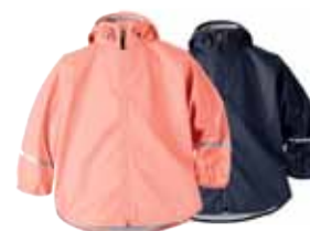
EDLYN REGNSLÁ 9.995 KR.