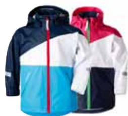
GULL REGNJAKKI 8.995 KR.