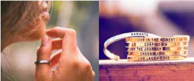
Möntruhringir sem eru líka hálsmen