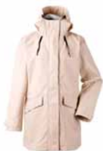
BOJAN JAKKI 17.995 KR.