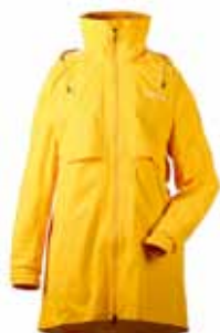
MILLY PARKA JAKKI 19.995 KR.