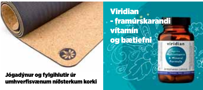
Jógadýnur og fylgihlutir úr umhverfisvænum niðsterkum korki

Viridian - framúrskarandi vítamín og bætiefni