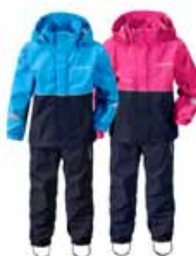
RUSK POLLAGALLI 13.995 KR.