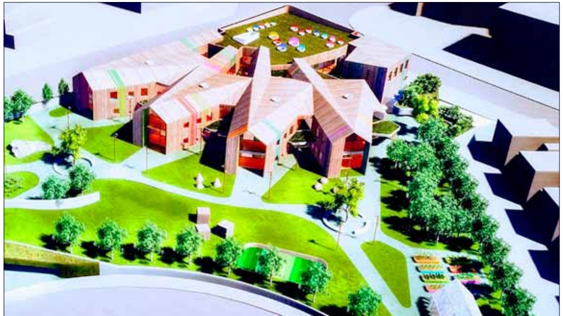
Þannig lítur hugmynd Andrúms arkitekta að nýjum leikskóla á Seltjarnarnesi út.