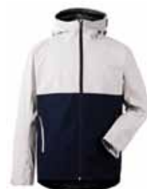
TUBA JAKKI 19.995 KR.