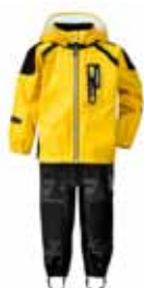
SPRAY POLLAGALLI 14.995 KR.