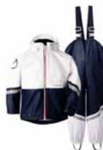
WATERMAN POLLAGALLI 9.995 KR.