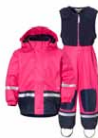
BOARDMAN POLLAGALLI 12.995 KR.