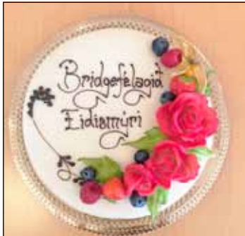
Veitingar voru veglegar eins og sjá má.

Félagið er opið öllum Seltirningum og eldri borgurum úr öðrum bæjarfélögum. Næsta spila ár hefst 16. ágúst 2019. Hægt er að bæta við borðum og vel tekið á móti þeim, sem koma.