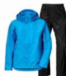
GRAND YOUTH REGNFÖT SETT 13.995 KR.