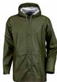
AVON REGNJAKKI 7.995 KR.