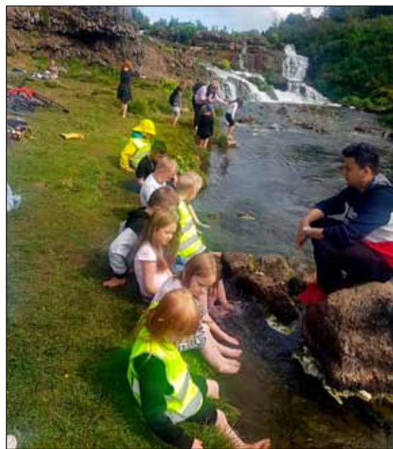
Gott að hvíla fætturnar í volgum læk eftir göngutúr.