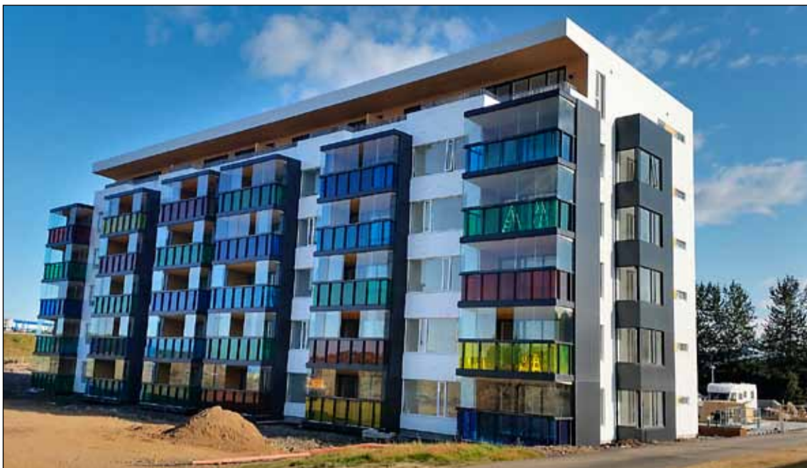
Byggingar Félags eldri borgara við Árskóga í Breiðholti.

Félag eldri borgara í Reykjavík hefur lagt fram sáttatilboð vegna sölu íbúða við Árskóga í Breiðholti. Líkt og komið hefur fram í fréttum voru kaupendur íbúanna krafðir um milljóna aukagreiðslu fyrir íbúðirnar vegna 400 milljóna aukakostnaðar sem varð til vegna vanáætlunar við undirbúning bygginga félagsins. Sumir kaupendur samþykktu að greiða aukagreiðsluna. Aðrir hafa ekki samþykkt og einstaka kaupendur hafa sagst ætla að fara í mál við félagið. Með sáttatilboðinu er vonast til að sem flestir gangi að kaupum á íbúðunum þótt ekki sé hægt að fullyrða um að það eigi við alla.