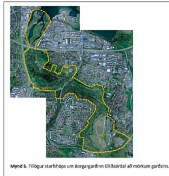
Mynd 5. Tillögu starfshóps um Borgargarðinn Elliðaárdal að mörkum garðsins.

Þá kemur fram í umsögn Umhverfisstofnunar (UST) frá 4. mars 2019, við breytingu á deiliskipulagi við Stekkjabakka, að þróunarsvæðið sé víðfeðmara en