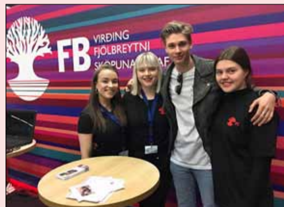
Glaðir nemendur FB á góðri stundi í skólanum.

Skólinn seinkaði skólabyrjun að morgni fyrir nokkru úr 8:15 í 8:30 og hefur það gefist vel. Nemendur skólans sem eru skráðir í íþróttir hafa aðgang að World Class Breiðholti á virkum dögum frá kl. 8 til 16, án endurgjalds. Geta þá nemendur nýtt sér eyður til að skella sér í ræktina eða sund. Skólinn leggur áherslu á heilbrigðan lífsstíl og góðar svefvenjur.