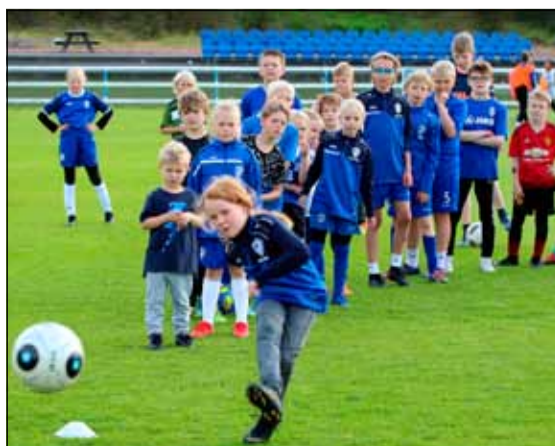
Fjölgreinatækifæri verður í boði í Breiðholti í vetur.

Með ÍR-UNGUM og ÍR-TVENNU er ÍR í forystu meðal íþróttafélaga landsins og býður upp á einstakt tækifæri fyrir börn í 1.-4. bekk grunnskóla til að prófa sig áfram í íþróttum þar til þau finna sína uppáhalds íþrótt. Þessi verkefni auka fjölbreytileika í íþróttátttöku barna með lægri kostnaði.