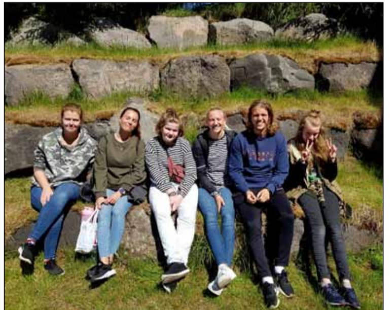
Slappað af í veðurblíðunni í sumar.