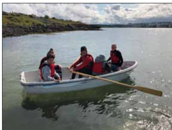
Hjá siglingaklúbbnum Siglunesi.