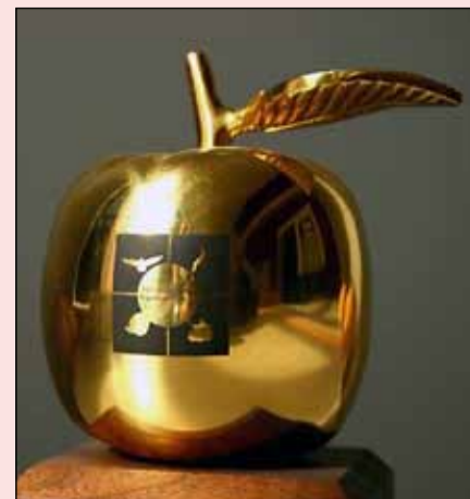
Gulleplið er hinn glæsilegasti gripur.

svefnvenjur nemenda sinna. Í skólanum hefur markviss fræðsla átt sér stað fyrir nemendur um mikilvægi svefns fyrir ungt fólk. Einnig eru gerðar tilraunir með upphaf skólabyrjunar og skólinn býður upp á sveigjanleika fyrir þá nemendur sem á þurfa að halda. Skólinn vann markvisst að því að taka upp þá þætti sem taldir eru skipta hvað mestu máli til að bæta svefnvenjur nemenda. Áhersla er lögð á svefn og svefnvenjur í foreldrasamstarfi, að nemendum sé gefinn kostur á að hefja skóladaginn síðar í samráði við námsráðgjafa og tekur þannig tillit til einstaklingsbundinna þarfa. Þá er nemendum gefið frí í fyrsta tíma eftir skólaball þannig að þau nái átta tíma svefni þrátt fyrir skólaskemmtun.