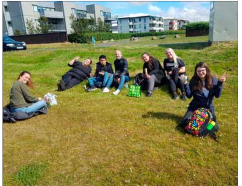
Þátttakendur í sumarstarfinu nutu margra sólarstunda sumar.