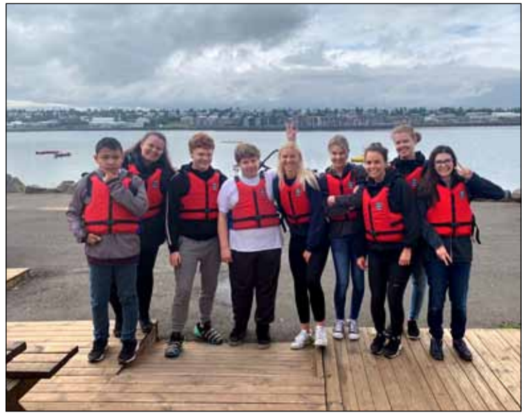
Allir tilbúnir að fara í siglingu.

Í vinnuskóla Hellisins er leitast við að fræða unglingana um fyrstu skrefin á vinnumarkaðinum ásamt því að þau sinna raunhæfum verkefnum helming vinnutímans til dæmis garðvinnu í kringum félagsmiðstöðina, þrífum innan félagsmiðstöðvarinnar, elda, baka og fá hagnýtar fræðslur s.s. Jafningjafræðsluna og græna fræðslu Vinnuskólans. Hinn helming vinnutímans fara þau í heimsóknir í fyrirtæki þar sem þau fá að heyra um starfsemina ásamt því að fara í skemmtiferðir bæði innanbæjar sem og styttri ferðir út fyrir höfuðborgarsvæðið. Einnig var góð stemming frá sumarfrístundinni Álfheimum í Hólabrekkuskóla því margt var brallað í sumarblíðunni. Hvalasafnið var heimsótt, prófað að klifra í klifurturninum í Gufunesbæ, virkjaferð og buslað í Elliðarárdalnum.