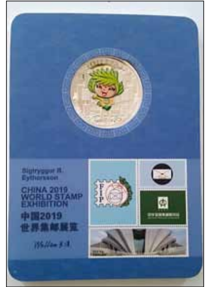
Gullverðlaunapeningurinn sem Sigtryggur Rósmar hlaut.