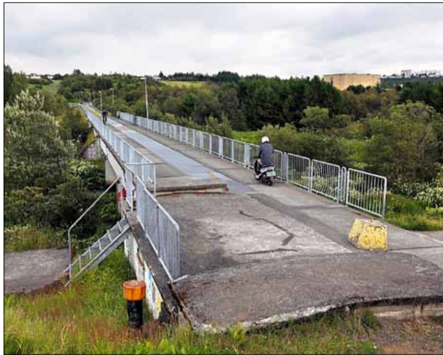
Gamli veitustokkurinn yfir Elliðaárnar.

Stokkarnir yfir Elliðaárdal eiga sér sögu. Hún nær áttafíu ár aftur í tímann. Fyrsti stokkurinn var lagður þegar Reykjaæð var lögð úr Mosfellssveit á stríðsárum frá 1939 til 1943. Þeir hafa þeir unnið sér sess sem samgönguæð þeirra sem ganga, hlaupa og hjóla í dalnum.