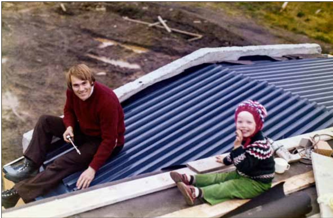
Daði við vinnu upp á þaki á byggingartímanum við Stuðlasel. Dóttir hans situr hjá honum.