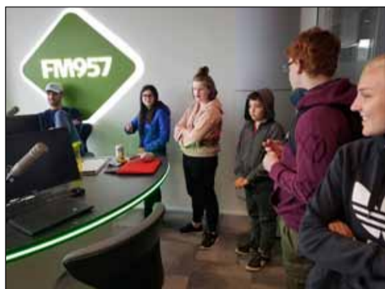
Farið var í heimsókn á Sýn.