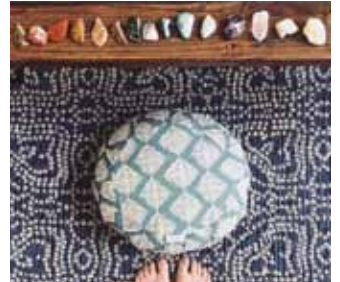
Jógavörur í úrvali