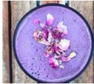
Villtur íslenskur aðalbláberjalatte