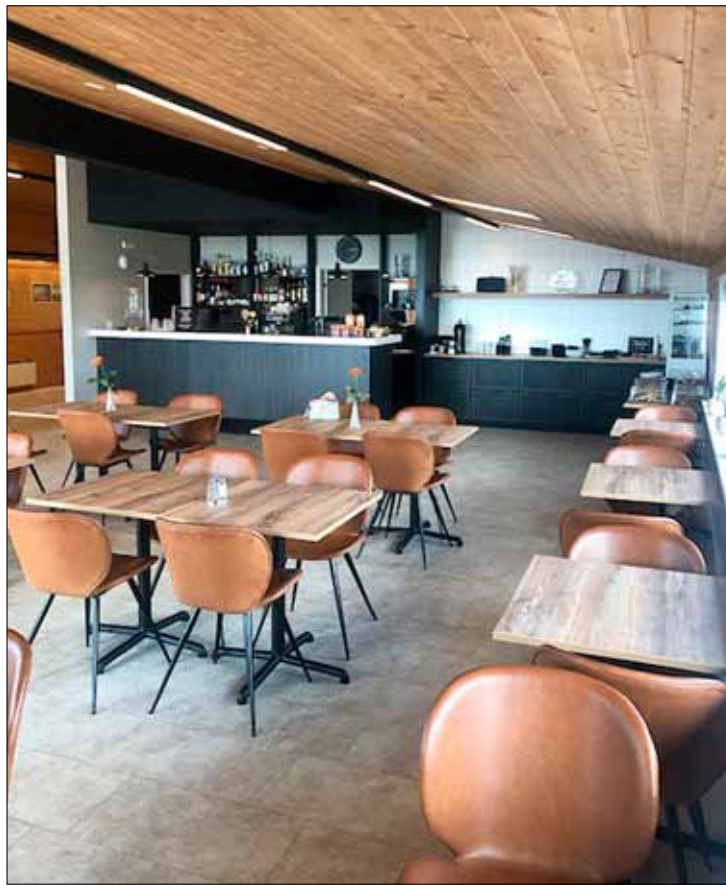
Veitingasalurinn í golfskálunum var allur endurnýjaður.