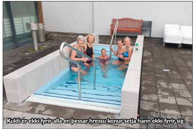
Kuldi er ekki fyrir alla en þessar hressu konur setja hann ekki fyrir sig.

svo mikill miskilningur því það er alveg hægt að koma í sund án þess að synda. Það er hægt að slappa af í pottum, kerjum, eimbaði og laugum, allt með mismunandi hitastigi og spjalla við aðra sundlaugargesti. Þetta er tilvalinn vettvangur til að finna góðan félagsskap í fallettu umhverfi. Hvað vilja menn meira? Síðan er boðið uppá fritt kaffi til kl. 11 á morgnana eftir sundið.