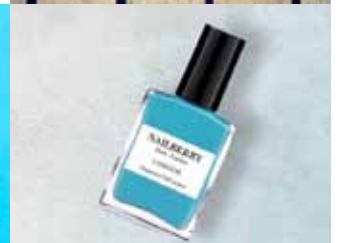
Nailberry eru vegan. Án 12 skaðlegustu efna.