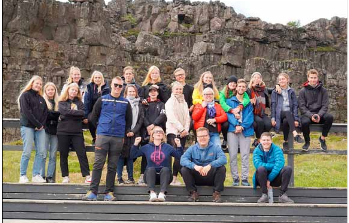
Ungmennaráðin fóru meðal annars á Þingvelli og skoðuðu sig um.