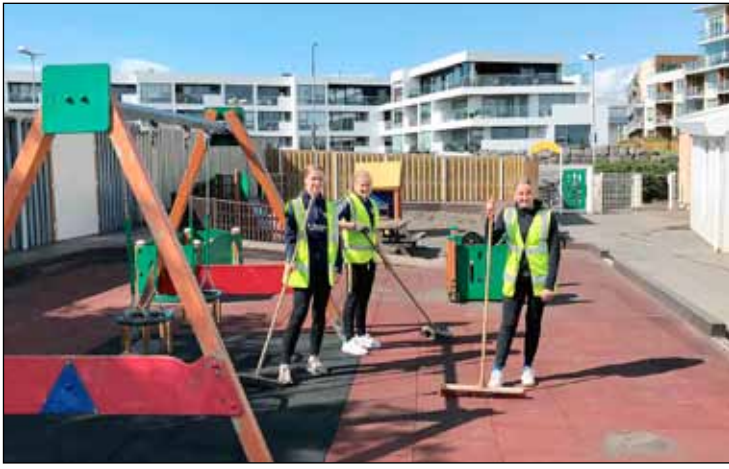
Góða veðrið skemmdi ekki fyrir vinnuskólakrökkunum í sumar.