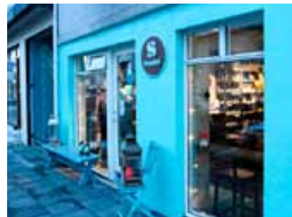
Þar sem andinn býr í efnum