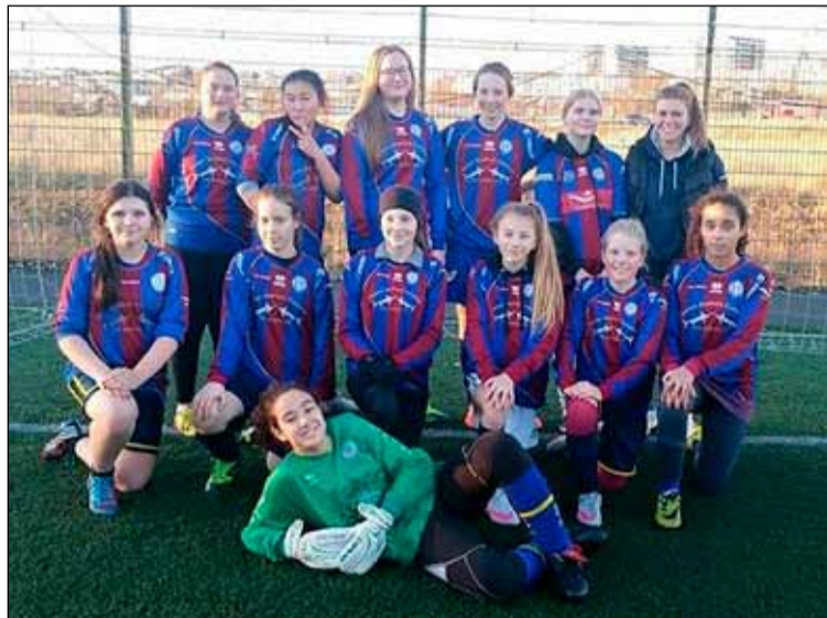
Stelpur sem stunda fótbolta hjá Leikni í Efra-Breiðholti.

Ástæður þessa kunna að vera nokkrar en ein helsta er talin sú að erfiðlega hefur gengið að fá krakka af erlendum uppruna til íþróttastarfs. Þar getur komið til sögu menningarleg arfleifð. Að fjölskyldur barna hafi ekki alist upp við íþróttir og þekki jafnvel ekki til þeirra. Tungumálakunnátta foreldra og efnahagur getur einnig skipt máli. Foreldrar sem ekki hafa náð góðum tókum á Íslensku geta verið tregari til þess að yta börnum sínum í íþróttastarf jafnvel þótt börnin hafi þegar góð tók á málinu. Þá getur efnahagur og einnig menntun ráðið nokkru um. Tölur sýna að fleiri hafa þegið fjárhagsaðstoð frá Reykjavíkurborg í Efra Breiðholti en í öðrum hverfum og borgarhlutum á undanförunum árum. Þá eiga fleiri íbúar í Efra-Breiðholti minni skólagöngu að baki en gengur og gerist. Þegar upplýsingar voru teknar saman í tengslum við átaksverkefnið Menntun núna árið 2013 voru um 40% íbúa á aldrinum 25 til 54 ára aðeins með grunnskólapróf. Sambærileg hlutfallstala í öðrum hverfum Reykjavíkur var tæp 23%. Allar þessar ástæðu