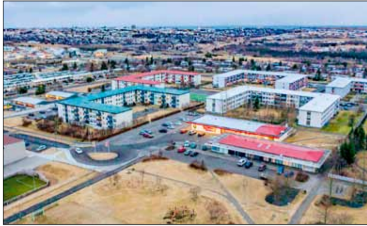
Séð yfir gömlu verslunarmiðstöðina við Arnarbakka sem nú er að fá nýtt líf.

Í Arnarbakka 2 eru Rauði kross Íslands með verkefnið Karlar í skúrnum. Verkefnið er unnið með það að markmiði að skapa