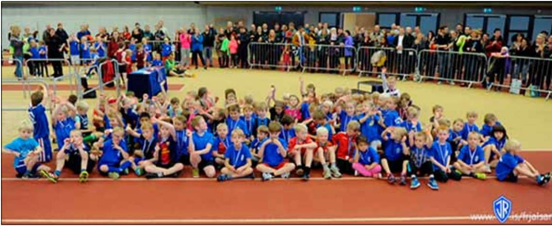
Frá Silfurleikum ÍR.

Silfurleikar ÍR verða haldnir í 24. sinn laugardaginn kemur 23. nóvember n.k. Þeir eru eitt stærsta og fjölmennasta frjálsíþróttamótið innanhúss sem haldið er ár hvert. Verða þeir sem fyrr haldnir í Laugardalshöll en mótið er eitt þriggja innanhússmóta sem ÍR-ingar standa fyrir á ári hverju en hin eru Bronsleikarnir og Stórmótið.