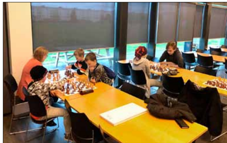
Setið að tafli í Leiknisheimilinu.