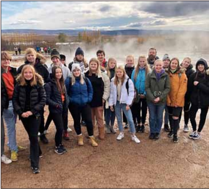
Erlendu þátttakendurnir og gestgjafar staddir á hverasvæði á Reykjanesi.