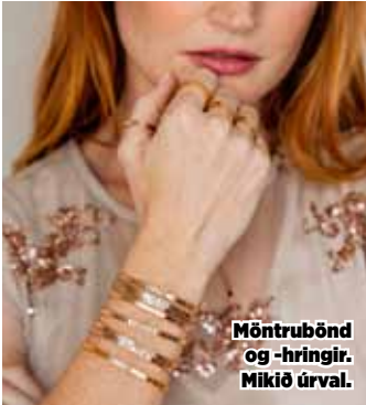
Möntrubönd og -hringir. Mikíð úrval.