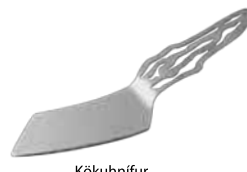
Kökunifur 12.800 kr.