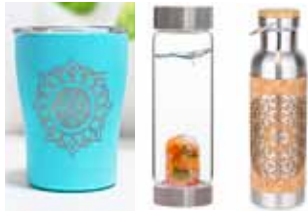
Möntrubollar, kristalsvatnsflöskur og korkbrúsar.