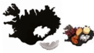
Íslandsbakkinn með Vatnajökulskál 12.900 kr.