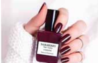
Nailberry naglalökk. Eiturefnalaus og vegan.