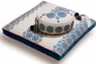
Hugleiðslupúðar og mottur. Einstök fegurð.