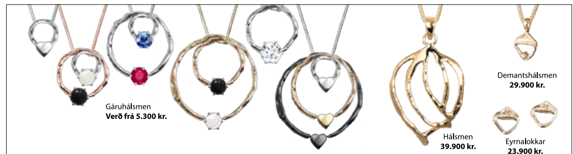
Gáruhálsmen Verð frá 5.300 kr.