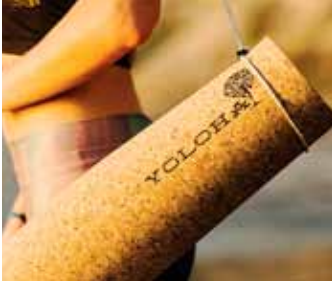
Jógadýnur úr korki eru framtíðin. Frábær gæðl.