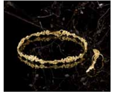
Gripir úr Erika skartgripalínunni sem hönnuð var í tilefni af 20 ára afmæli Aurum.