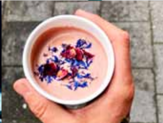
Cacaó og annað góðgæti á aðventunni.