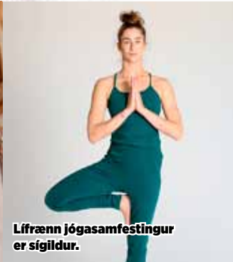
Lífrænn jógasamfestingur er sígildur.