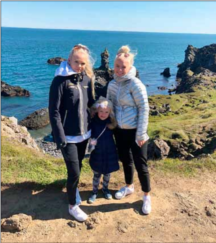
Dæturnar saman á góðri stund.