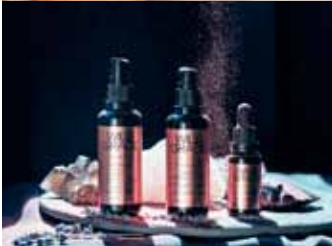
Wild Grace húðlínan er ný og mögnuð.