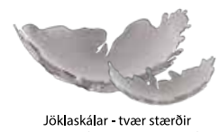
Jöklaskálar - tvær stærðir Vatnajökull, Eyjafjallajökull og Snæfellsjökull 4.900 - 7.900 kr.