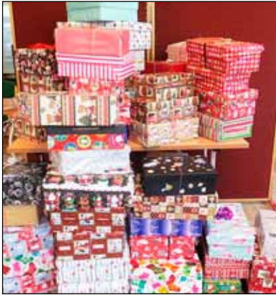
Nokkrir af þeim jólapökkum sem komu.

Hver einasta gjöf skiptir máli því hún er gjöf til barns sem býr við mjög erfiðar aðstæður í Úkraínu hvort sem það er munaðarlaust, fatlað, sjúkt eða býr við fátækt. Í ár söfnuðust um 4.656 gjafir á landinu öllu og er þetta í sextánda sinn sem þessi söfnun fer fram. Forsvarsfólk verkefnisins vill þakka fyrir fallegar gjafir og góða þátttöku.